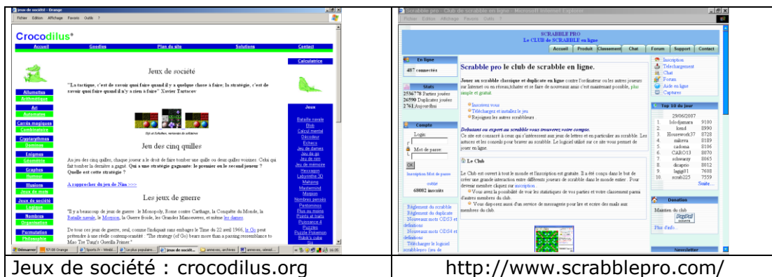
Jeux de société : crocodillus.org