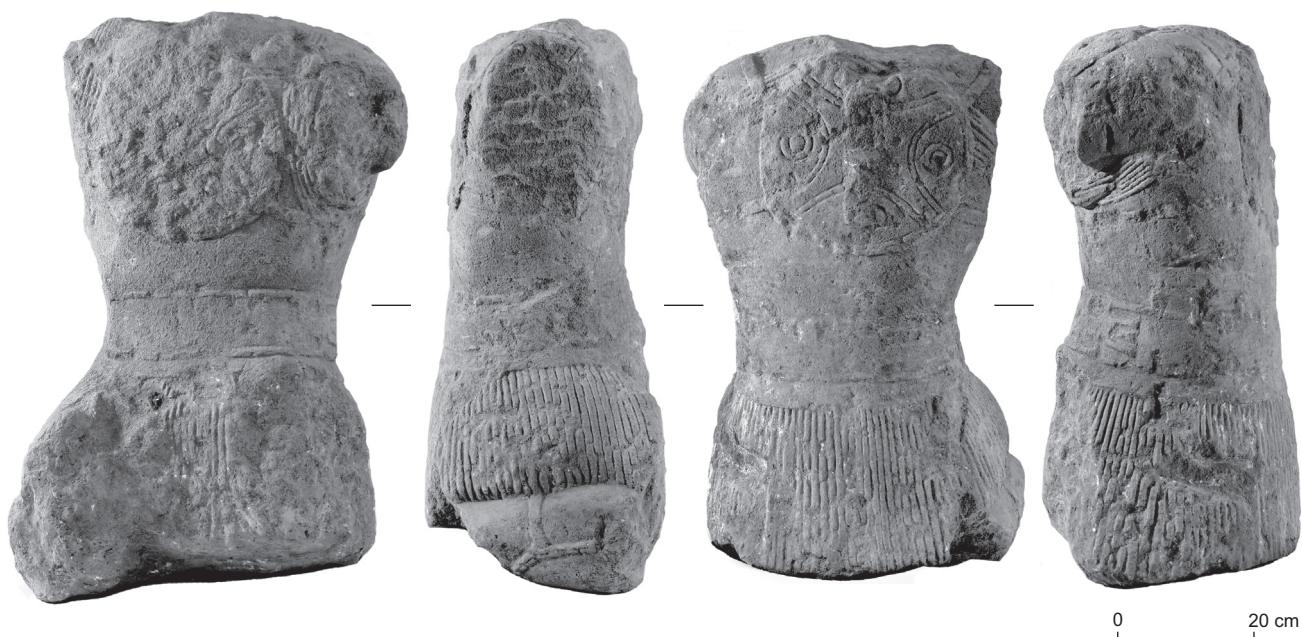
Fig. 42 – Les quatre faces du guerrier de Lattes.

connu, tant en Espagne qu'en Languedoc occidental : il est par exemple présent dans les tombes 14 et 15 de la nécropole du Grand Bassin II à Mailhac (Janin et al. , 2002), dans la tombe de Corno Lauzo à Pouzols-Minervois (Taffanel, Taffanel, 1960) et dans la tombe 75 de la nécropole de las Peyros à Couffoulens (Passelac et al. , 1981). Dans tous ces cas, l'objet est accompagné de mobiliers datables entre 525 et 475 av. J.-C. au plus tard.