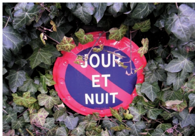
24 h / 24