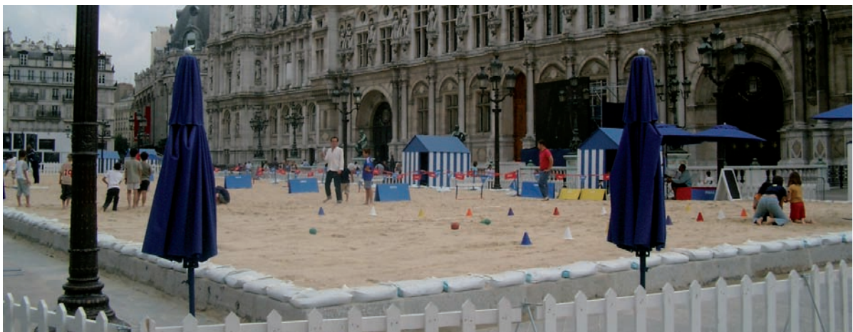
Vacances en ville