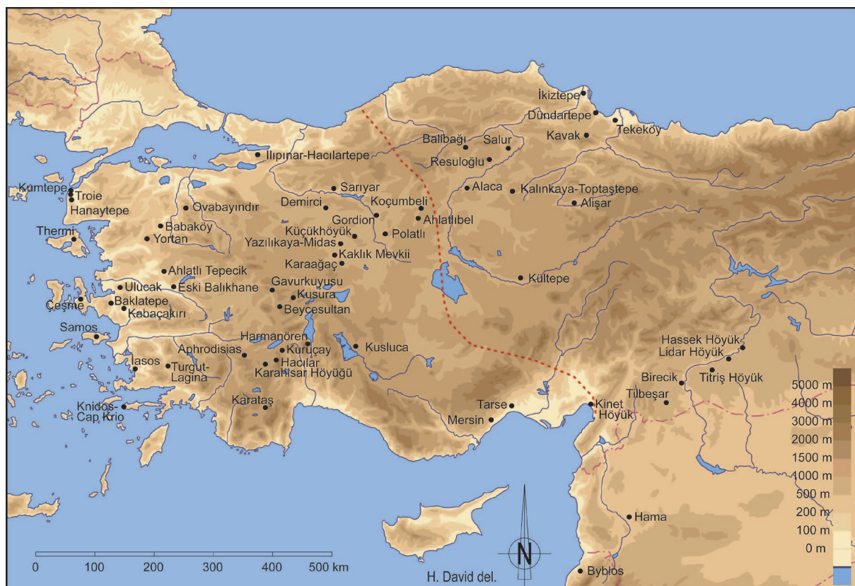
Fig. 1 : Carte de tous les sites cités dans le texte.

pratiques funéraires bouleversent également le monde des morts. Cette période est le théâtre, sur l'ensemble de la région considérée, du développement d'importantes nécropoles extra-muros qui peuvent contenir jusqu'à plusieurs centaines d'individus, d'une part, et de la diffusion de la pratique de l'inhumation en jarre, d'autre part.