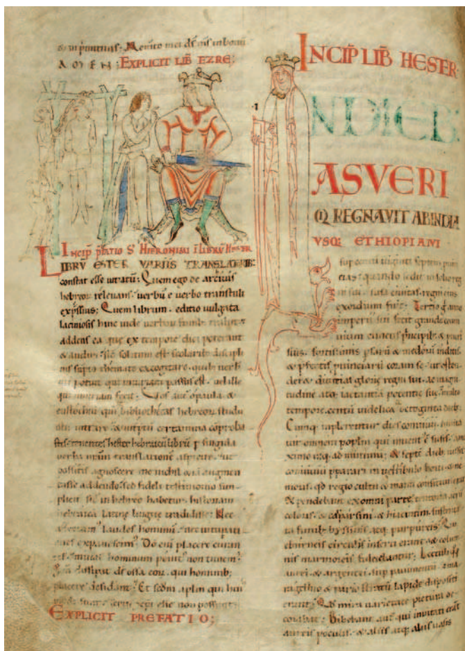
Fig. 1. Dijon, Bibliothèque Municipale, ms. 14, f. 122v

Come abbiamo già avuto modo di mostrare in altri studi sulla stessa immagine 13 , la miniatura della Bibbia di Cîteaux presenta diverse particolarità rispetto alle altre rappresentazioni medievali dello stesso episodio. In particolare, queste ultime raffigurano generalmente Ester in un atteggiamento di sottomissione al re, in modo da sottolinearne l'umiltà. Nella Bibbia di Stefano Harding, invece, il corpo della donna forma l'iniziale I ( In diebus ) della colonna destra del testo: dritta e imponente, Ester è dietro le spalle del re e osserva la scena trionfando su un drago. Anche l'immagine di Assuero presenta un particolare insolito: egli non tiene lo scettro, elemento chiave del racconto biblico presente in tutte le rappresentazioni medievali di questo re, ma una spada.