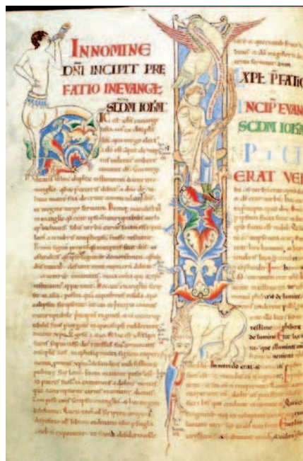
Fig. 5. Dijon, Bibliothèque Municipale, ms. 15, f. 56v

Inoltre, la penetrazione degli organi di senso del monaco Ario da parte dell'aquila in volo sembra ispirarsi al commentario di sant'Agostino sul Vangelo di Giovanni che invita il lettore a elevare gli occhi, le orecchie e tutti i sensi corporei e a lasciarsi penetrare dalle Scritture 28 . L'azione dell'aquila in volo è così spiegata: penetrando i sensi del monaco Ario e elevandolo, lo costringe alla lettura mistica del Vangelo mentre contemporaneamente ne svela l'eresia. E' dunque logico pensare che il monaco-eretico è probabilmente colpevole di non praticare la lettura mistica: egli potrebbe dedicarsi allora alla lettura analitica che, diffondendosi a partire dal XII secolo nelle scuole urbane e cattedrali, incontrava le critiche degli autori monastici 29 . Ario diventa dunque figura esemplare di un dialettico. L'accostamento di eresia e dialettica (o filosofia) non è del resto sorprendente: esso è abituale nell'ambito della polemica che oppose le scuole monastiche e le scuole cattedrali durante i secoli XI e XII 30 . L'immagine acquista tutto il suo senso se inserita nel contesto di questa polemica, a cui Cîteaux non era evidentemente estranea.