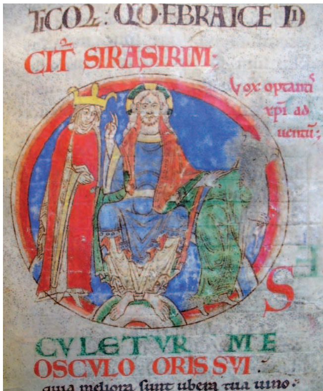
Fig. 2. Dijon, Bibliothèque Municipale, ms. 14, f. 60r

La lettura tipologica può essere applicata a tutta l'immagine, che si rivela così una visione sintetica dei rapporti tra la Chiesa e il potere spirituale. Il ruolo dell'instituzione ecclesiastica ne risulta esaltato, a scapito del potere temporale. In questo contesto l'inserimento nella miniatura