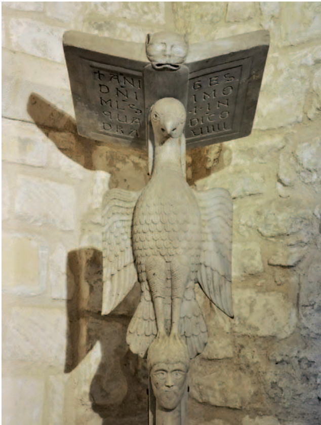
Fig. 6. Monte Sant'Angelo (FG, Italie), Museo lapidario e museo devozionale del Santuario di San Michele, lectorino di pulpito dello scultore Acceptus (1041)

In definitiva, le tre miniature analizzate illustrano alcuni dei processi di creazione iconografica delle miniature della Bibbia di Stefano Harding. Vere e proprie opere esegetiche, le immagini assegnano una molteplicità di significati al testo biblico. Proprio come i commentari biblici medievali, esse invitano a oltrepassare il livello letterale, provocano la diffrazione 32 di senso di un episodio e invitano l'osservatore a penetrare intellettualmente le scene rappresentate. E' quindi naturale chiedersi se le immagini possano fornire delle interpretazioni secondo i quattro sensi della Scrittura, quali essi erano teorizzati dagli autori medievali.