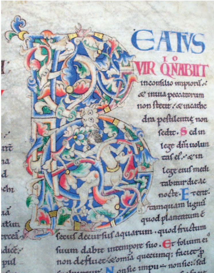
Fig. 7. Dijon, Bibliothèque Municipale, ms. 14, f. 14

L'individuazione di immagini che possano essere interpretate secondo un senso anagogico è meno scontata. In generale possiamo osservare che alcune immagini medievali erano considerate, in alcuni casi, come oggetti capaci di suscitare il transitus dall'esperienza terrestre a quella divina: esse possono dunque essere ritenute anagogiche per l'azione che esse esercitano sull'osservatore 36 . Nell'alto Medioevo, preoccupati di incorrere nell'accusa di iconodulia, gli autori occidentali negavano tale proprietà alle immagini. E' soltanto a partire dall'inizio dell'XI secolo che essi cominciano a riconoscere ad alcuni temi iconografici un'influenza sull'osservatore. Secondo Gerardo di Cambrai, il crocifisso avrebbe così il potere di imprimersi