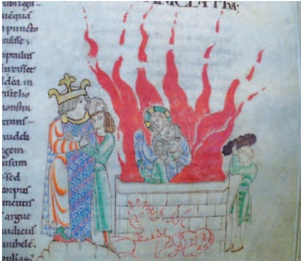
Fig. 8. Dijon, Bibliothèque Municipale, ms. 14, f. 64

La visione della fornace in questa immagine acquista una tonalità anagogica: Cristo che, al posto dell'angelo del Signore, prende tra le braccia i tre fanciulli Ebrei richiama infatti potentemente le rappresentazioni del seno di Abramo, figura del paradiso 40 . Del resto, anche il tema dei fanciulli salvati nella fornace è tradizionalmente una prefigurazione della salvezza dell'anima 41 . Il creatore delle immagini ha saputo dunque fondere le due formule iconografiche per comporre una sapiente rappresentazione che evoca il Paradiso e gli eletti. In questo contesto, appare chiaro che la personificazione del fuoco che brucia i servitori del re o i Caldei, in primo piano nell'immagine, mostra per contrasto la sorte che attende i dannati. La miniatura rappresenta dunque una vera e propria visione dell'aldilà, con il paradiso e l'inferno, a partire dal racconto biblico dei tre ebrei nella fornace, offrendo un'interpretazione anagogica di questo episodio.