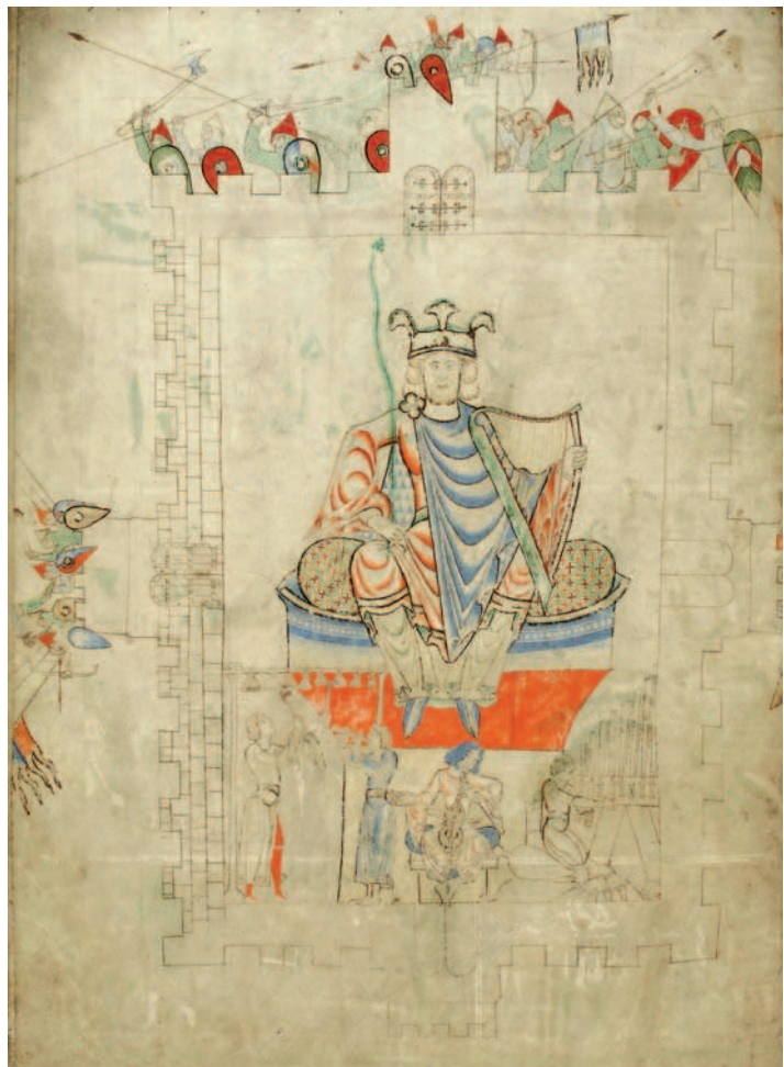
Fig. 3. Dijon, Bibliothèque Municipale, ms. 14, f. 13v

A differenza dell'immagine di Ester, la miniatura che precede l'inizio del libro dei Salmi (ms. 14, f. 13v, Fig. 3) non è narrativa e non illustra alcun episodio biblico in particolare: essa