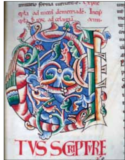
11 - Dijon, Bibliothèque Municipale, ms 135, f. 23.

La comparaison peut être élargie aux autres initiales des Lettres représentant des entrelacs de végétation et éventuellement des animaux : elles se rapprochent de celles de la Bible représentant le même sujet, comme le démontrent l'initiale O du ms 14, f. 136v, et l'initiale Q du 135, f. 17v (ill. 9 et 10) : encore une fois, rien ne permet de penser qu'elles soient l'œuvre d'un artiste différent.