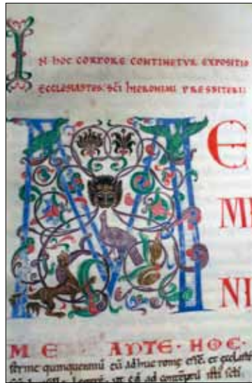
18 - Dijon, Bibliothèque Municipale, ms 132, f. 191.