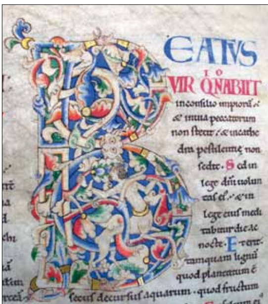
7 - Dijon, Bibliothèque Municipale, ms 14, f. 14r.