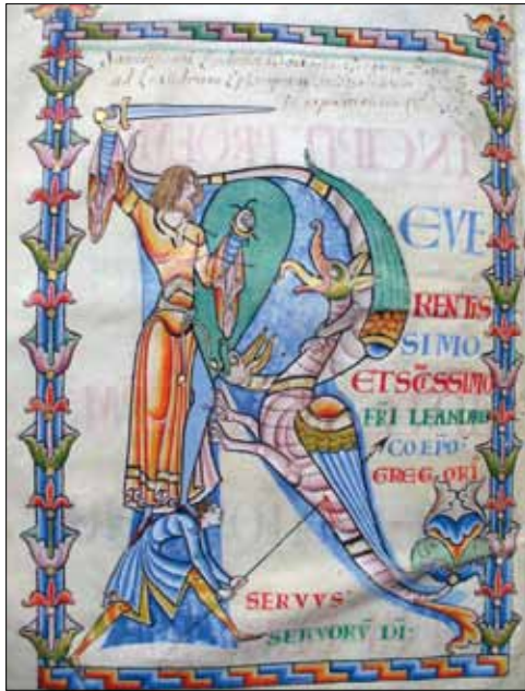
3 - Dijon, Bibliothèque Municipale, ms 168, f. 4v.