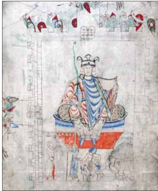
4 - Dijon, Bibliothèque Municipale, ms 14, f. 13v.