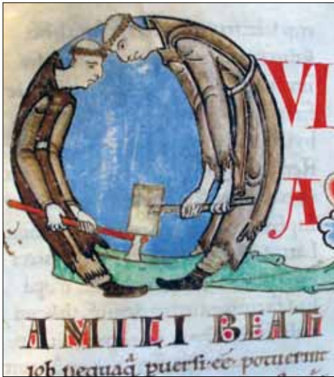
12 - Dijon, Bibliothèque Municipale, ms 170, f. 59.