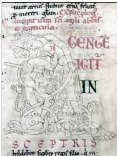
14 - Dijon, Bibliothèque Municipale, ms 642, f. 58.