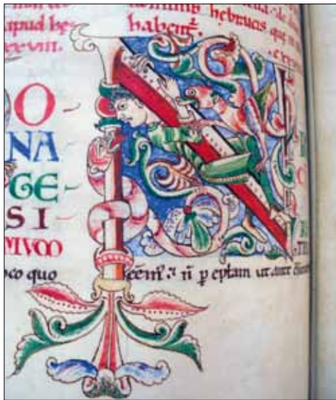
5 - Dijon, Bibliothèque Municipale, ms 135, f. 177v.