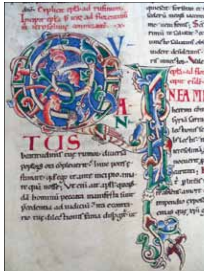
10 - Dijon, Bibliothèque Municipale, ms 135, f. 17v.