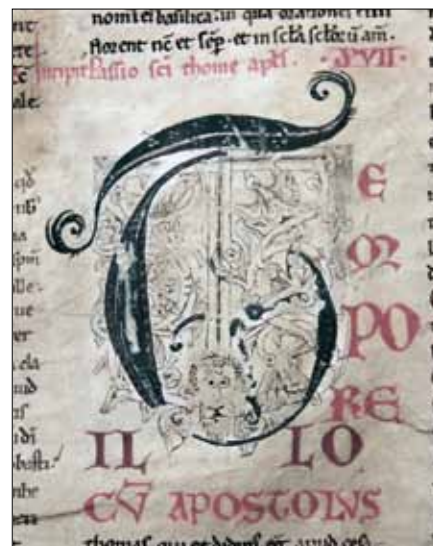
16 - Dijon, Bibliothèque Municipale, ms 642, f. 40.