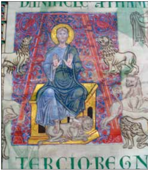
17 - Dijon, Bibliothèque Municipale, ms 132, f. 2v.