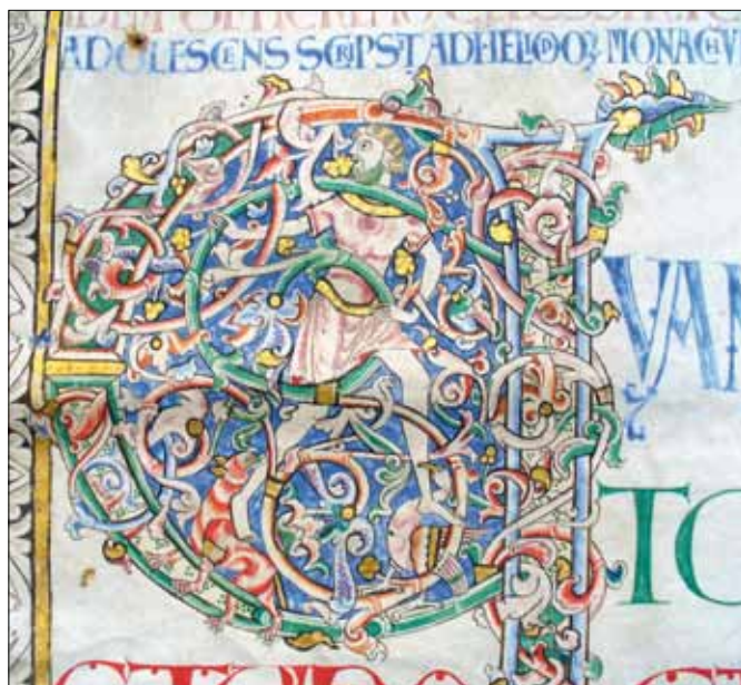
8 - Dijon, Bibliothèque Municipale, ms 135, f. 2v.