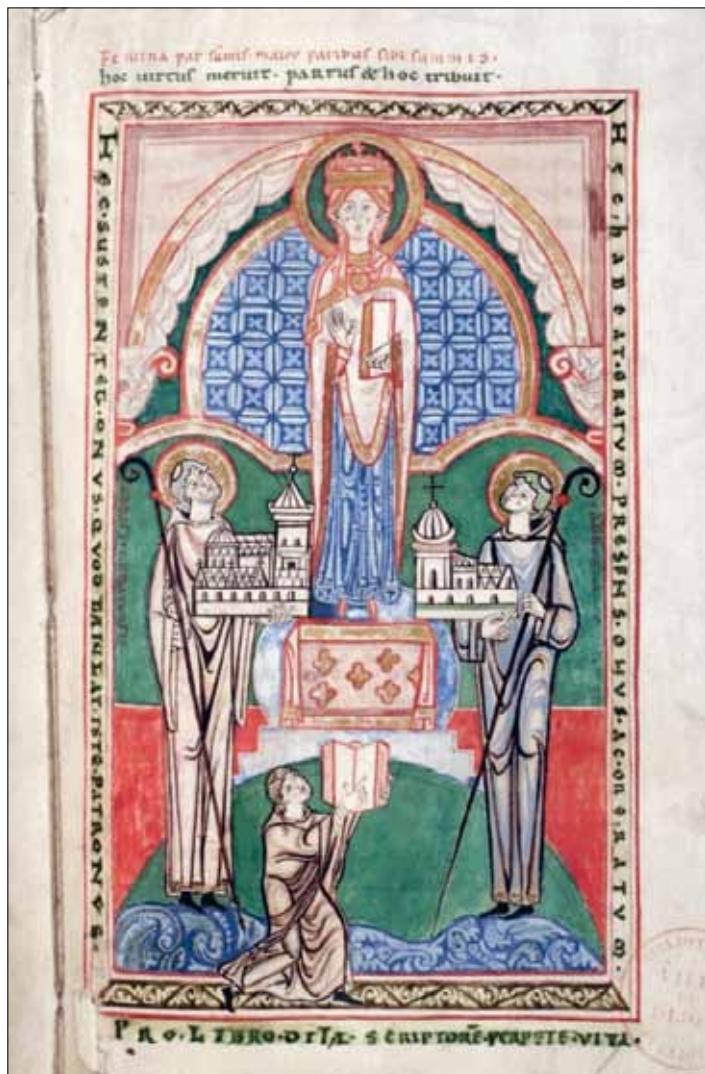
2 - Dijon, Bibliothèque Municipale, ms 130, f. 104r.

Cîteaux et demande à Oisbertus les Commentaires sur Jérémie de Jérôme pour l'abbaye bourguignonne. Le moine copie donc le manuscrit et réalise probablement aussi l'image au f. 104r, en vis-à-vis du texte, qui le représente lorsqu'il tend le livre vers le haut et de gauche à droite, comme dans une double offrande à la Vierge et à Étienne Harding 9 . Cette notice est un témoignage important de l'échange de manuscrits entre des abbayes et semble attester que les miniatures étaient le fait des moines. De plus elle est l'une des nombreuses preuves de l'attention qu'Étienne Harding, abbé de Cîteaux, portait aux manuscrits 10 . Oisbertus n'est certes pas un moine de Cîteaux, mais l'intervention des religieux de l'abbaye bourguignonne semble logique là où des manuscrits enluminés sont décorés par la même main à plusieurs années d'intervalle : il pourrait donc s'agir de moines qui ont vécu durablement à l'abbaye.