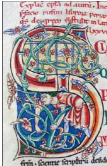
13 - Dijon, Bibliothèque Municipale, ms 135, f. 114v.

(ms 15, f. 68) est un modèle attesté uniquement en Angleterre 21 . La harpe du roi David (ms 14, f. 13v, [ill. 4]) serait aussi d'une forme connue dans les Îles britanniques 22 . À ces remarques, on pourrait ajouter le système de notation inscrit sur l'orgue d'un des musiciens de David : il s'agit du système des lettres utilisé dans les pays anglo-saxons (C, D, E, etc.) différent de celui introduit par Guido d'Arezzo (Ut, Re, Mi, etc.) et utilisé en France au début du XII e siècle. L'enlumineur semble connaître également des manuscrits réalisés dans les Îles Britanniques. Selon une proposition convaincante de C. Treat Davidson, le ruisseau et les oiseaux de l'initiale Q au début du 35 e chapitre des Moralia (ms 173, f. 174) s'inspireraient de ceux du mois d'octobre de quelques calendriers anglo-saxons du XI e siècle (Londres, BL, Cotton Tiberius B. V, f. 7v; Cotton Iulius A. VI, f. 7v) 23 . Enfin, selon Walter Cahn, l'insertion de l'image d'Arius au début de l'Évangile de Jean dans la Bible d'Étienne Harding (ms 15, f. 56v) s'inspirerait de l'évangélaire d'Eadwius, enluminé à Canterbury aux environs de 1020 24 .