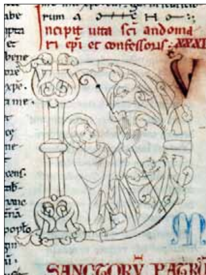
15 - Dijon, Bibliothèque Municipale, ms 642, f. 65v.