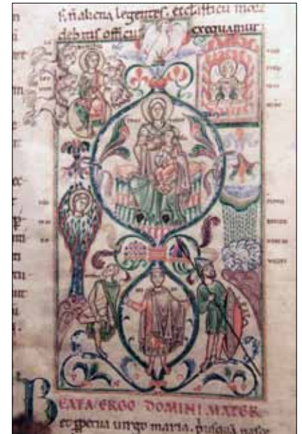
19 - Dijon, Bibliothèque Municipale, ms 641, f. 40v.