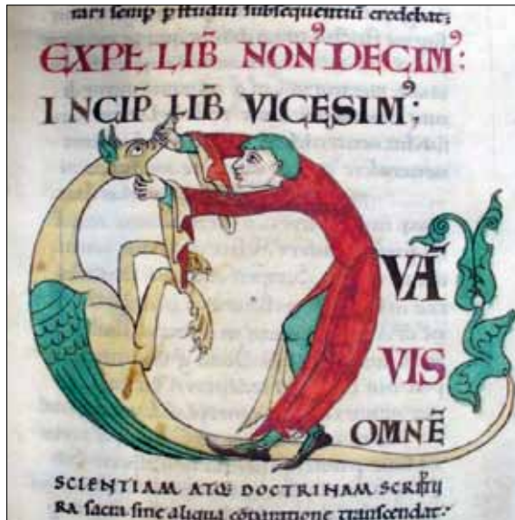
6 - Dijon, Bibliothèque Municipale, ms 173, f. 29.