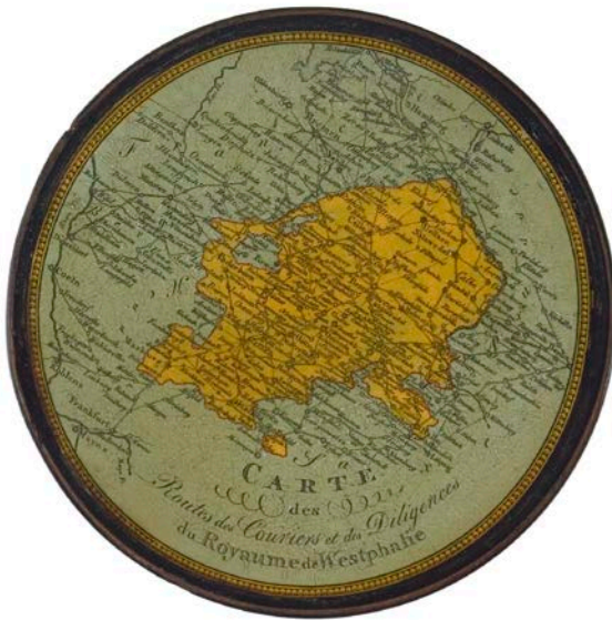
Abb. 1: Schnupftabakdose mit einer »Carte des Routes, des Couriers et des Diligences du Royaume de Westphalie« auf dem Deckel, Manufaktur Stobwasser, Braunschweig, nach 1808, 1,8 x 10 cm, Städtisches Museum Braunschweig, St. 83, Foto: Jakob Adolphi [Die Verwendung dieser Abbildung bedarf in jedem Fall der Genehmigung durch das Städtische Museum Braunschweig].