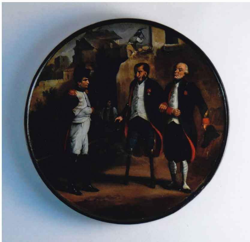
Abb. 5: Schnupftabakdose »Napoleon in Austerlitz«, bezeichnet »57. Sire! c'est à Austerlick que j'ai été démoli«, Stobwasser-Manufaktur, Braunschweig, um 1815, 1,8 x 10 cm, Privatbesitz.