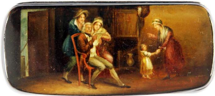
Abb. 8: Schnupftabakdose, bezeichnet »La bonne nouvelle«, Fabrik Lukutin, Russland, 1818–1828, 2,7 x 10 x 4,4 cm, Privatsammlung Braunschweig.

dans l'intérieur«, die ihm »trop facile et trop néfaste« erschien 201 . Die Soldaten würden lauter »details affligeans« von ihrer Position bei der Armee preisgeben, die eine »très mauvaise sensation sur l'esprit des Conscrits qui ne sont point aguerris«, habe und ebenfalls die öffentliche Meinung negativ beeinflussen. Bongars schloss: