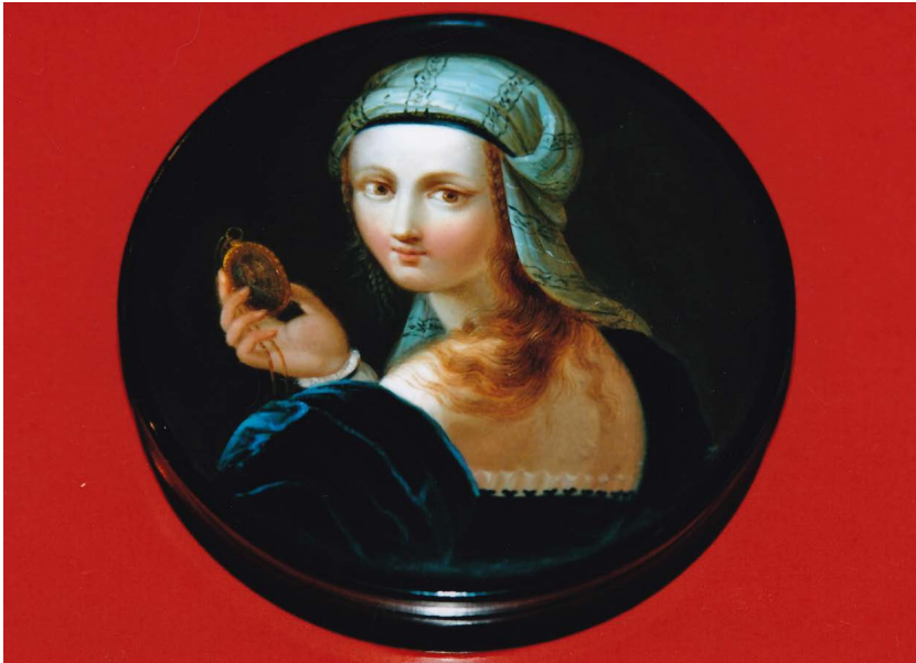
Abb. 3: Schnupftabakdose »Mädchen mit Miniatur«, signiert »4516. Stobwassers Fabrik«, Stobwasser-Manufaktur, erstes Drittel des 19. Jahrhunderts, 2 x 9,9 cm, Privatbesitz.

hinter dem Ofen wiedergefunden zu haben 175 . Die Mutter nahm es in den folgenden Rücksprachen mit der Obrigkeit auf sich, den Brief ihres Sohnes beiseite geschafft zu haben, um ihn dann angeblich zufällig wiederzufinden. Eine Geschlechtsspezifität könnte hier ausgemacht werden: Lag der Mutter nicht mehr als den anderen Beteiligten am Erhalt der Originalschrift ihres Sohnes, die sie vor der endgültigen Vernichtung des Briefes zurückhielt 176 ? Frauen konnten traditionell mehr Schuld auf sich nehmen als ihre Männer, da sie als Unmündige mit weniger Strafe zu rechnen hatten 177 .