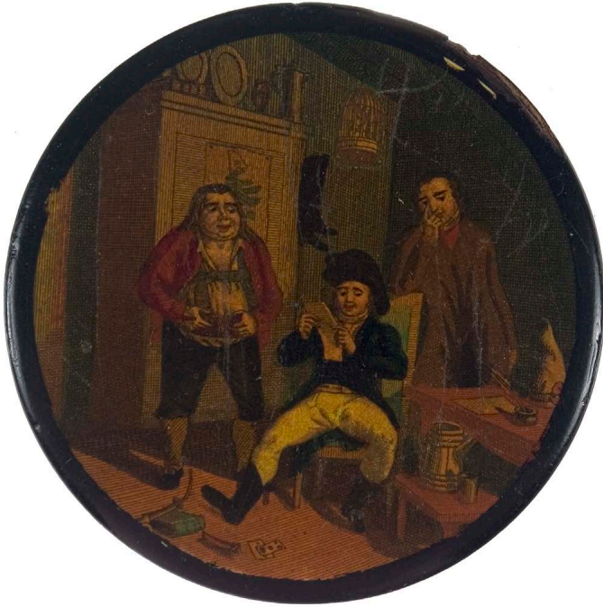
Abb. 9: Schnupftabakdose »Der Briefleser«, unbekannte Manufaktur, erstes Drittel des 19. Jahrhunderts, 1,7 x 8 cm, Städtisches Museum Braunschweig, St. 382, Foto: Jakob Adolphi [Die Verwendung dieser Abbildung bedarf in jedem Fall der Genehmigung durch das Städtische Museum Braunschweig].

So geriet die Korrespondenz der in Kassel und Hannover getrennt lebenden Eheleute Lohr ins Visier der Polizei, weil Frau Lohr die Briefe ihres Mannes unmittelbar nach deren Ankunft in ihrem Haus den gerade Anwesenden vorlas: