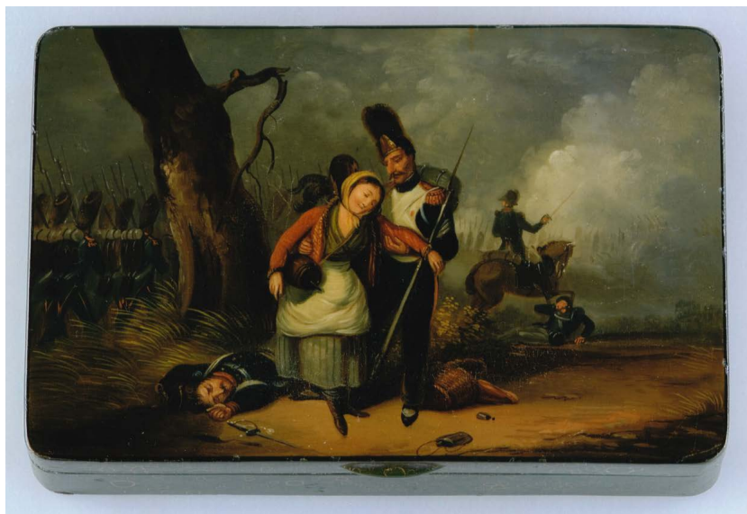
Abb. 6: Tabakdose, Trauer um einen Soldaten, wohl Stobwasser-Manufaktur, erstes Drittel des 19. Jahrhunderts, Braunschweig, 3 x 13,1 x 8,8 cm, Privatbesitz. In dieser Szene aus den napoleonischen Kriegen wird eine junge, trauernde Marketenderin neben einem Gefallenen von einem französischen Soldaten mit Bajonette im Arm gestützt, während der Kampf im Hintergrund weitergeht.