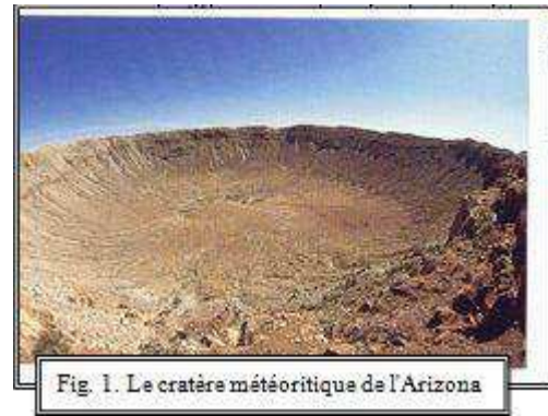
Fig. 1. Le cratère météoritique de l'Arizona

Les cratères météoritiques sont des structures circulaires creusées par la chute d'une météorite de dimension importante. La première structure d'impact reconnue fut celle du Meteor crater d'Arizona (USA). Aujourd'hui, on connaît plus de 160 cratères répartis à travers le monde.