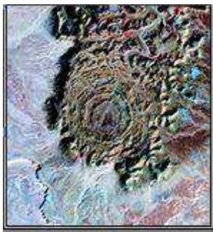
Fig. 6 : Cratère de Tin Bider

D'autres sites peuvent être visités en allant vers les deux cratères à la périphérie du Hoggar (Amguid et Tin bider).