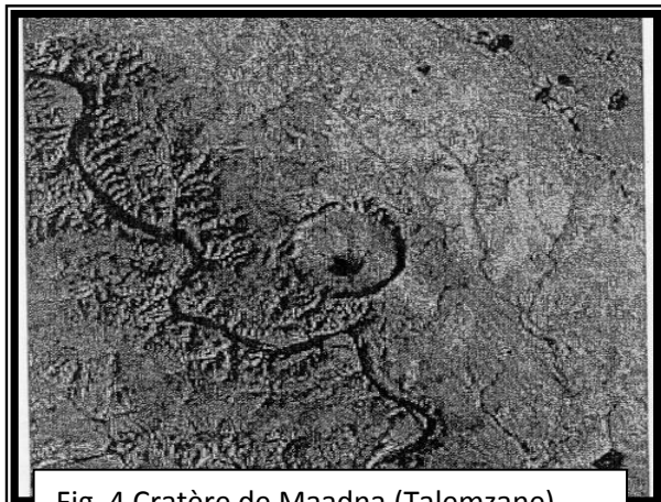
Fig. 4 Cratère de Maadna (Talemzane)

Il est aussi appelé cratère de Talemzane, Karpoff (1954) et Monod (1965). Il a pour coordonnées 33°19'Nord et 004°02' Est. Cratère d'un diamètre de 1750 mètres et profond de 55 mètres