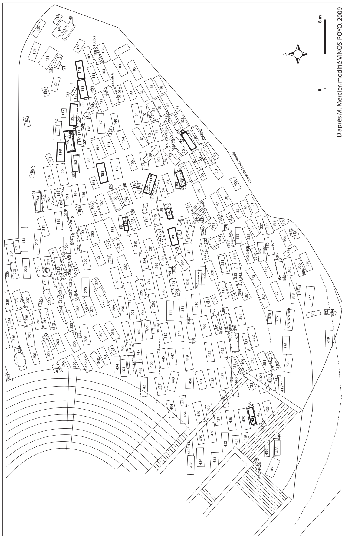
D'après M. Mercier, modifié VINOS-POYO, 2009