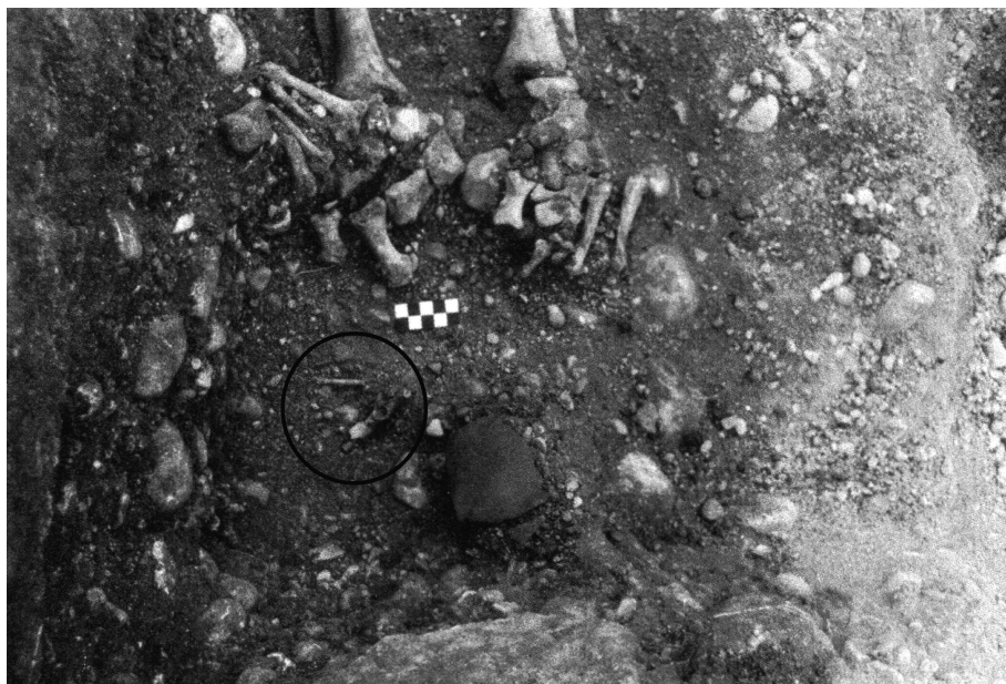
Fig. 3. Tombe 144. Restes de lièvres près des pieds.

équien lors du remplissage de la sépulture peut revêtir plusieurs interprétations : symbole du pouvoir de l'individu, matérialisation de son rôle terrestre (si l'individu était un cavalier par exemple) ou encore rôle psychopompe de l'animal. L'altération de ce vestige dénote cependant une assez longue exposition à l'air ne nous permettant sans doute pas de confirmer les hypothèses précédentes. Au cours de la période mérovingienne, les équivalents sont inexistantes mais certains exemples antérieurs témoignent de pratiques comparables. Ainsi, au cours du Haut-Empire à Valladas (BEL, 2002), les équidés, à l'inverse des autres animaux, sont essentiellement représentés (symbolisés?) dans les tombes par des pièces non bouchères isolées 2 , ce que l'on peut rapprocher du cas de Crotenay.