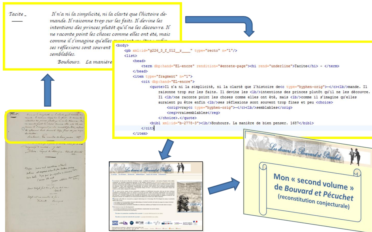
La chaîne de production des seconds volumes possibles de Bouvard et Pécuchet