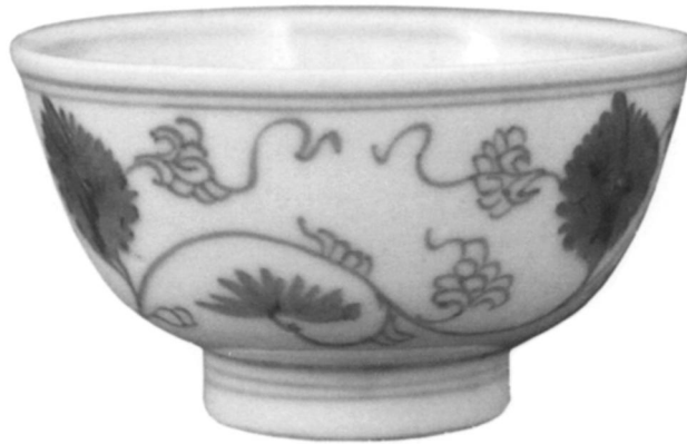
5 Tasse de porcelaine chinoise, fin XVIIe–début XVIIIe s. (d'après J. Carswell, Chinese Ceramics in the Sadberk Hanım Museum [Istanbul, 1995], 105, fig. 128; Fondation Vehbi Koc)