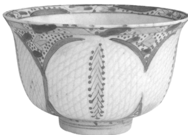
4 Fincan de Kütahya, première moitié XVIIIe s. (d'après L. Soustiel, Splendeurs de la céramique ottomane du XVIe au XIXe siècle [Istanbul, 2000], 116, fig. 64; Fondation Vebhi Koç)