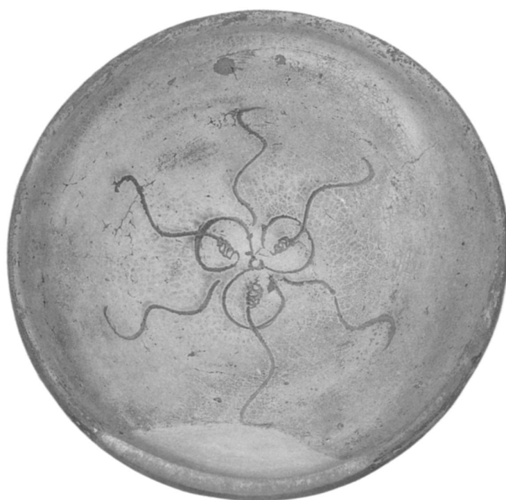
3 Aegean ware de l'épave de Castellorizo, début XIIIe s. (d'après D. Papanikola-Bakirtzis, Byzantine Glazed Ceramics , 150, fig. 175; Archaeological Receipts Fund)