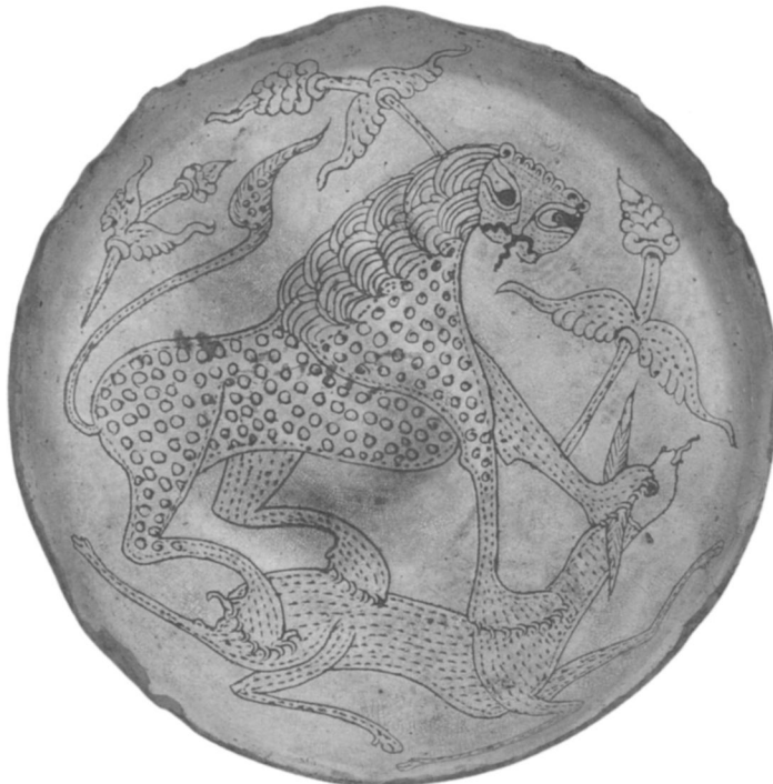
2 Fine sgraffito byzantin de l'épave de Pélagonnisos, milieu XIIe s. (d'après D. Papanikola-Bakirtzis, Byzantine Glazed Ceramics [Athens, 1999], 123, fig. 134; Archaeological Receipts Fund)