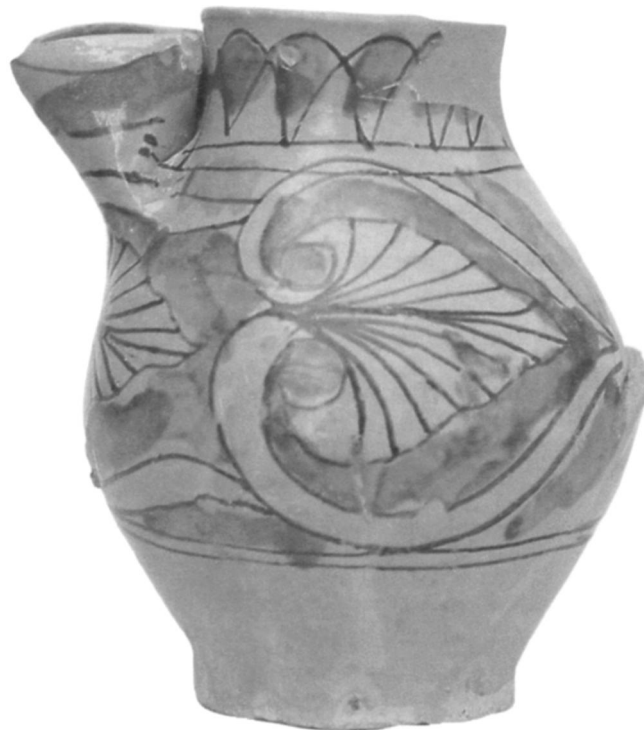
6 Cruche de proto-majolique, région d'Orvieto, XIIIe s. (d'après A. Ragona, La maiolica siciliana da le origini all'ottocento [Palermo, 1975], 43, fig. 17)