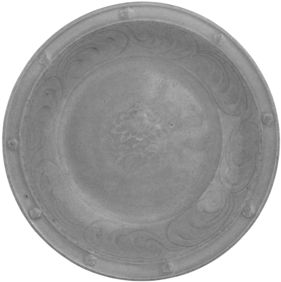
8 Céladon, première moitié XIVe s. (d'après Carswell, Chinese Ceramics in the Sadberk Hanım Museum , 25, fig. 7; Fondation Vehbi Koç)