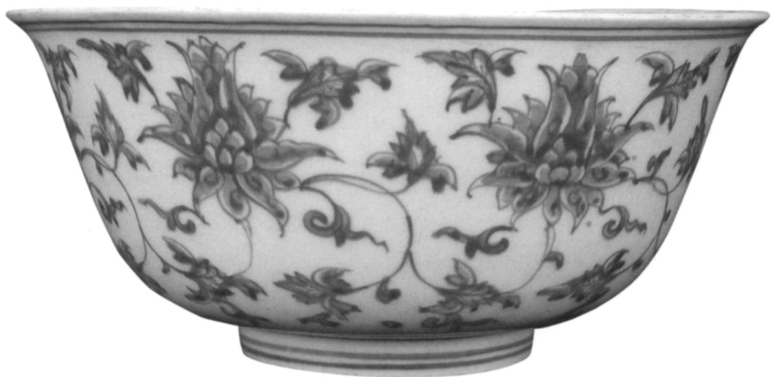
9 Porcelaine bleu-blanc, fin XVe-début XVIe (d'après Carswell, Chinese Ceramics in the Sadberk Hanım Museum , 52, fig. 44; Fondation Vehbi Koç)