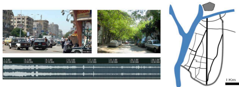
Figure 2. Le sonogramme montre la transition sonore et l'effet de fondue-enchaîné entre le boulevard de Choubrah et une rue résidentielle.