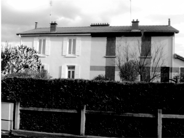
L'habitat Michelin proche de sa conception originelle. Quatre maisons (RDC +1 niveau) mitoyennes. Façades de deux d'entre-elles.