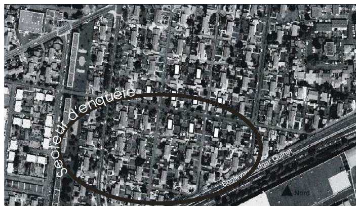
Sud est du quartier de la Plaine. Le volume original de la maison Michelin est indiqué en blanc, tout le reste étant les extensions initiées par les propriétaires. (Source : à partir des photos aériennes 2004, CERAMAC. Echelle approchée 1/6900e)