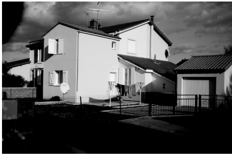
Les transformations de l'habitat : extensions (rajout de volume), embellissement du jardin (pelouses, terrasse...), nouveau traitement des clôtures, etc.