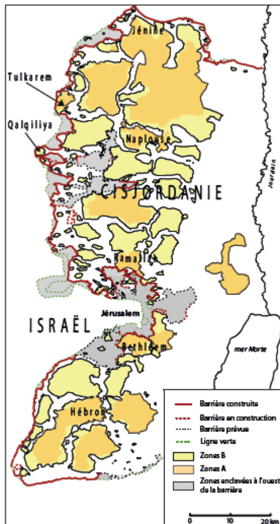
Carte 1. Zones palestiniennes A et B et enclaves entre les mur et la Ligne verte (2009). (© Carte M. Barazani, CRF, C. Parizot, IREMAM. Cartographie : OCHA Information Management Unit, juin 2009. Base de donnée et statistiques : Ocha, PA, MoP)

visent donc à la fois à reprendre durablement le contrôle sécuritaire des enclaves palestiniennes et à poursuivre le projet de séparation unilatérale.