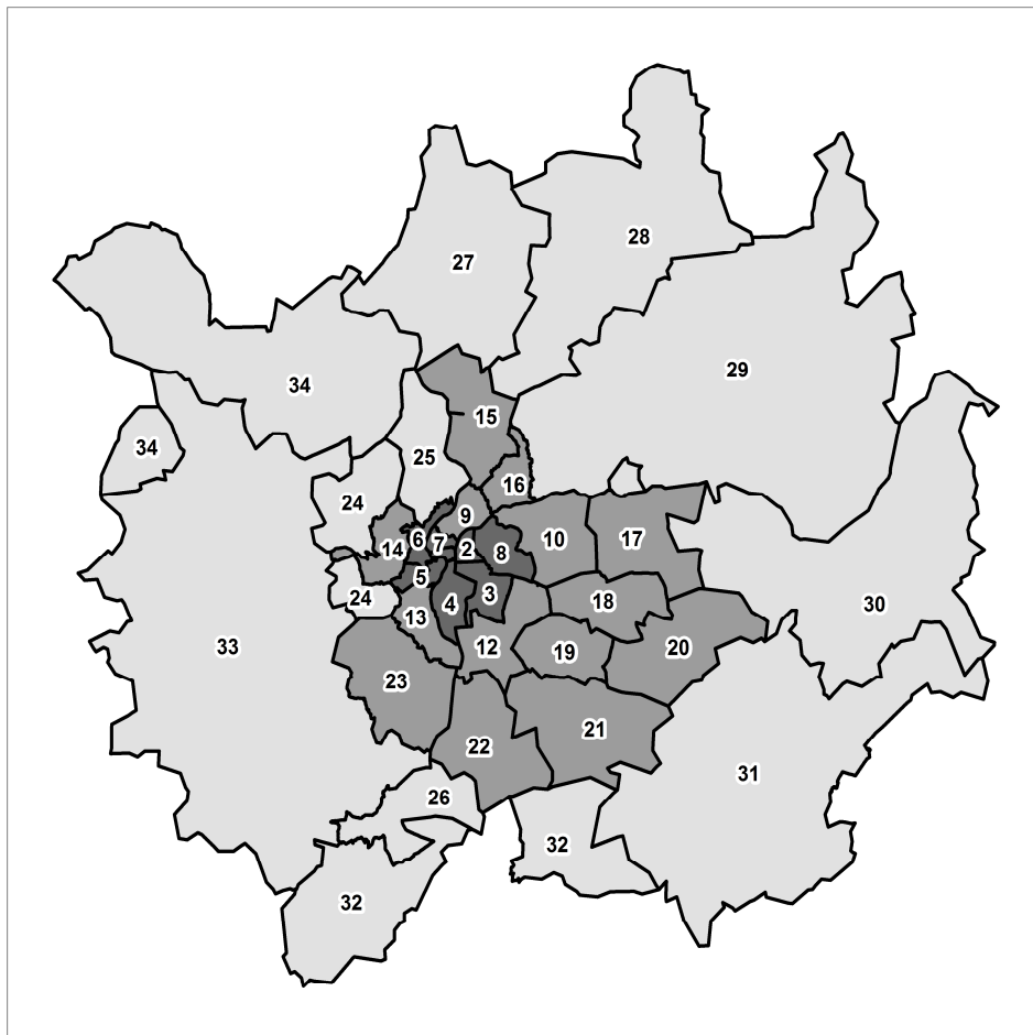
Figure 3 : Carte de l'aire urbaine de Lyon et zones d'étude (Gonzalez-Feliu et al., 2012)

Nous proposerons par la suite une analyse des boucles de déplacements liés aux achats des ménages sur l'aire urbaine de l'agglomération lyonnaise d'après les enquêtes ménages déplacements (EML) de 2006. Cette enquête, réalisée tous les 10 ans environ dans les grandes agglomérations françaises, est réalisée selon un cahier des charges standardisé. La zone d'études est l'aire urbaine qui compte 2 millions d'habitants et 800.000 ménages environ. Elle est divisée en 777 zones fines correspondant aux zones IRIS et que nous avons regroupées en 34 macro-zones (d'après le zonage SIMBAD, cf. Nicolas et al., 2009). Nous avons choisi ce regroupement comme territoire d'investigation.