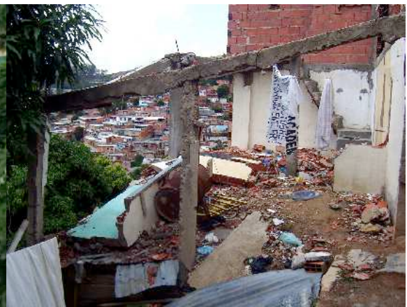
Foto 5: Deslizamiento en Mario Briceño Irragory, Municipio Libertador

Los sectores más peligrosos en términos de amenaza sísmica corresponden a sectores de clase media-alta, muy “formales”, en el centro Este de la ciudad (Rebotier, 2008)... A nadie se le ocurre hablar de asentamientos “informales” en estas situaciones.