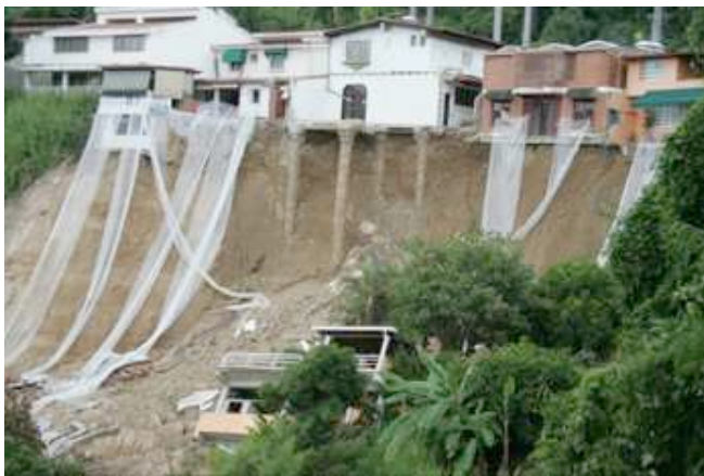
Foto 4: Deslizamiento en Santa Inés, Municipio Baruta ( El Universal 11 janvier 2006)

2- Las condiciones de vulnerabilidad han sido mencionadas en las características de la organización de las Naciones Unidas. La localización de los barrios sigue un mecanismo de exclusión socio-espacial vinculado con la renta del suelo urbano y la ausencia de regulación pública en la ocupación y la comercialización del suelo, concentrando a los “invasores” en terrenos de baja calidad, poco interesantes para el mercado (en la gran mayoría de los casos) y expuestos a las amenazas naturales. Sin embargo existen numerosas urbanizaciones ubicadas en fuertes pendientes, tan expuestas como muchos de los barrios . Y si una quinta resulta ser más resistente que un rancho, ninguna de las dos viviendas aguanta a la hora de un deslizamiento (Rebotier, s.d.b).