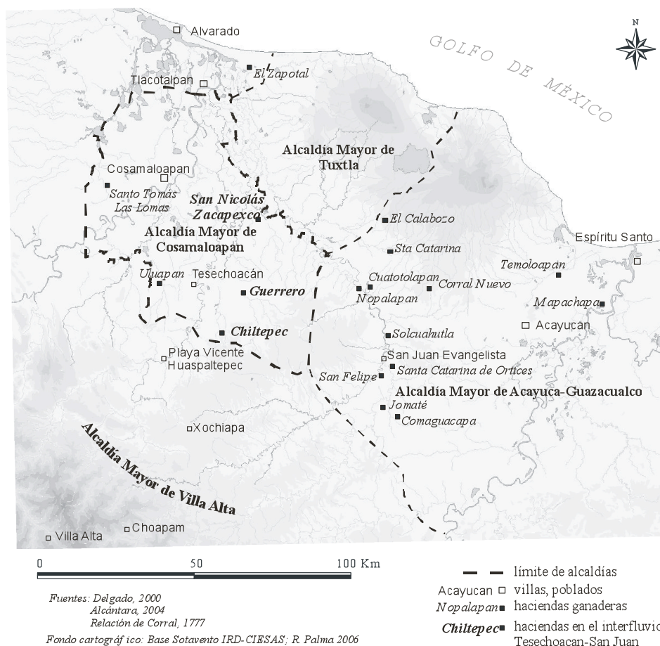
Figura 3: Principales estancias ganaderas y haciendas a fines del XVII

La situación sobre las tierras bajas más alejadas de la sierra fue completamente distinta. Ahí veríamos, todavía hasta finales del ochocientos, enormes extensiones de montes bajos y sabanas, tal vez herederos de la deforestación 10 , con hatos muy dispersos, cuyos primeros bovinos fueron introducidos desde el marquesado de Los Tuxtlas. Tales extensiones eran producto de la acumulación temprana de las sabanas a partir de la composición real de encomiendas, mercedes de tierras, estancias y sitios de ganado mayor que, para los siglos XVII y XVIII, ya formaban haciendas ganaderas en pleno auge (Alcántara, 2004; Celaya, 2005). En realidad se trató de latifundios prácticamente despoblados y cuyos dueños, siempre ausentes, al final casi perdieron en herencias olvidadas. Más cercanas a Cosamaloapan y Tlacotalpan, aunque de difícil acceso por los ríos y pantanos que les franqueaban, sus tierras nunca llegaron realmente a parecer verdaderas haciendas, es decir asentamientos caracterizados por tener habitaciones centrales -la dicha casa grande de otras partes- y anexos como molinos, bodegas, viviendas para peones; o al menos no restan vestigios visibles de ellos.