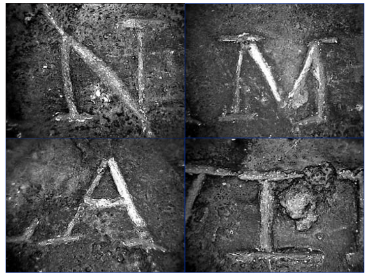
Fig. 5 — Détail de quelques lettres révélant leur tracé moderne.

Cette opinion affirmative se prouve, premièrement parce qu'on a trouvé parmi les cendres quatre médailles d'Auguste en moyen bronze, avec le frontispice de ce même Temple, & au revers la légende : Romae et Augusto. Secondement, à cause de l'endroit où l'urne a été trouvée. Troisièmement, par le goût même de l'inscription qui marque le noble et simple goût d'Auguste. Cette urne est dans le Cabinet d'Antiques du Collège des Jésuites de Lyon. Voyez les Mémoires de Trévoux au mois de décembre 1724, pages 2271 et 2272” (Expilly 1761, 52). La nouvelle de cette “découverte” est également reprise l'année suivante par le Journal des Savants (juillet 1725, vol. 77, p. 119).