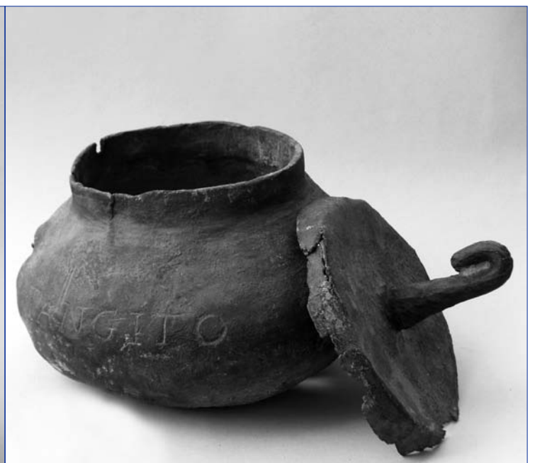
Fig. 1 et 2 — Urne en plomb inscrite avec son couvercle en place ; ht. de l'urne seule : 135 mm, Ø max. 210 mm.