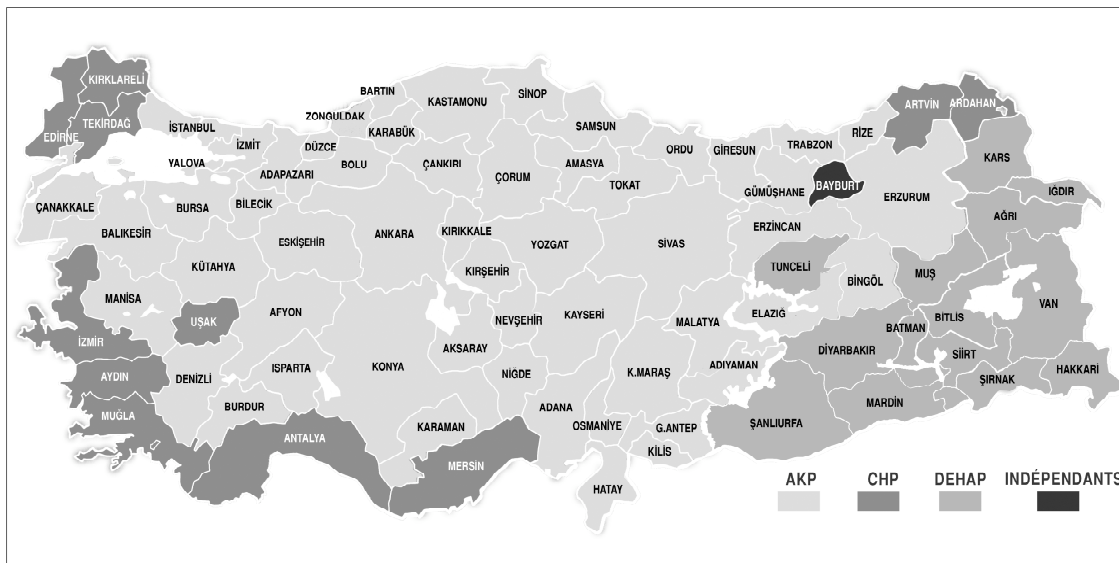
Carte des premiers partis par il , Milliyet, 4 novembre 2002

mieux éduquées. Ainsi, 42 % des diplômés d'université auraient voté pour le CHP, contre seulement 22,4 % pour l'AKP 222 .