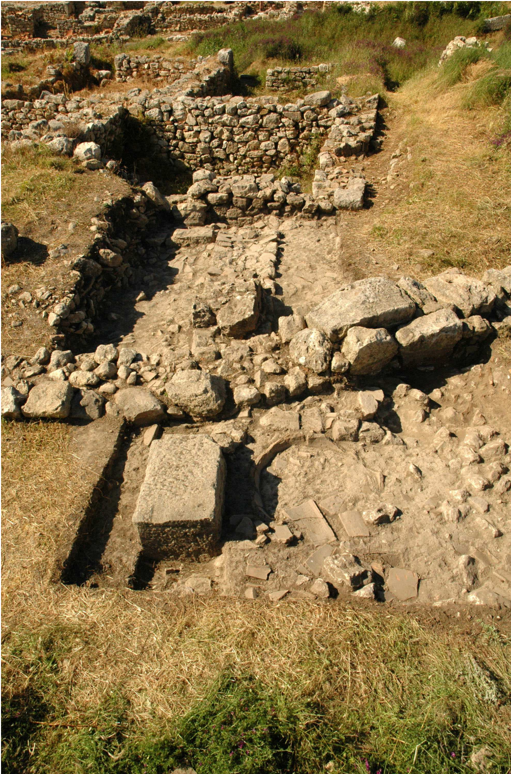
Fig. 2 - Byllis, pièce P3 et sondage P2B, vus vers l'est.