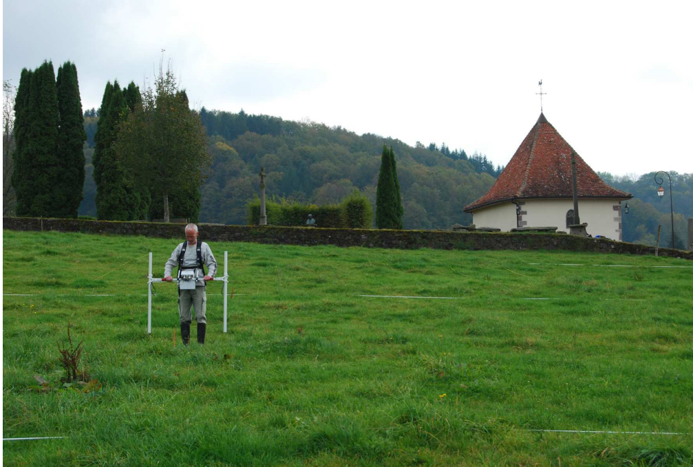
Fig. 2 - Annegray, prospection géophysique sur le flanc nord de la butte.

d'Annegray). C'est dans ce champ que des structures circulaires avaient été observées depuis le point de vue dominant de l'église Saint-Martin de Faucogney 3 . La surface étudiée a été divisée en trois secteurs, représentant un peu plus de 4 hectares. Seul le secteur n° 1, au nord de la butte, a révélé des vestiges et fait par conséquent l'objet d'une description. La méthode géophysique mise en œuvre à Annegray est celle de la magnétométrie à haute résolution ; les instruments utilisés sont deux Bardington Crad 601, l'un à gradiomètre unique et l'autre à gradiomètre double (fig. 2). Dans le même temps, nous avons dressé un relevé au tachéomètre laser des vestiges de l'église Saint-Jean-Baptiste et un relevé topographique du site.