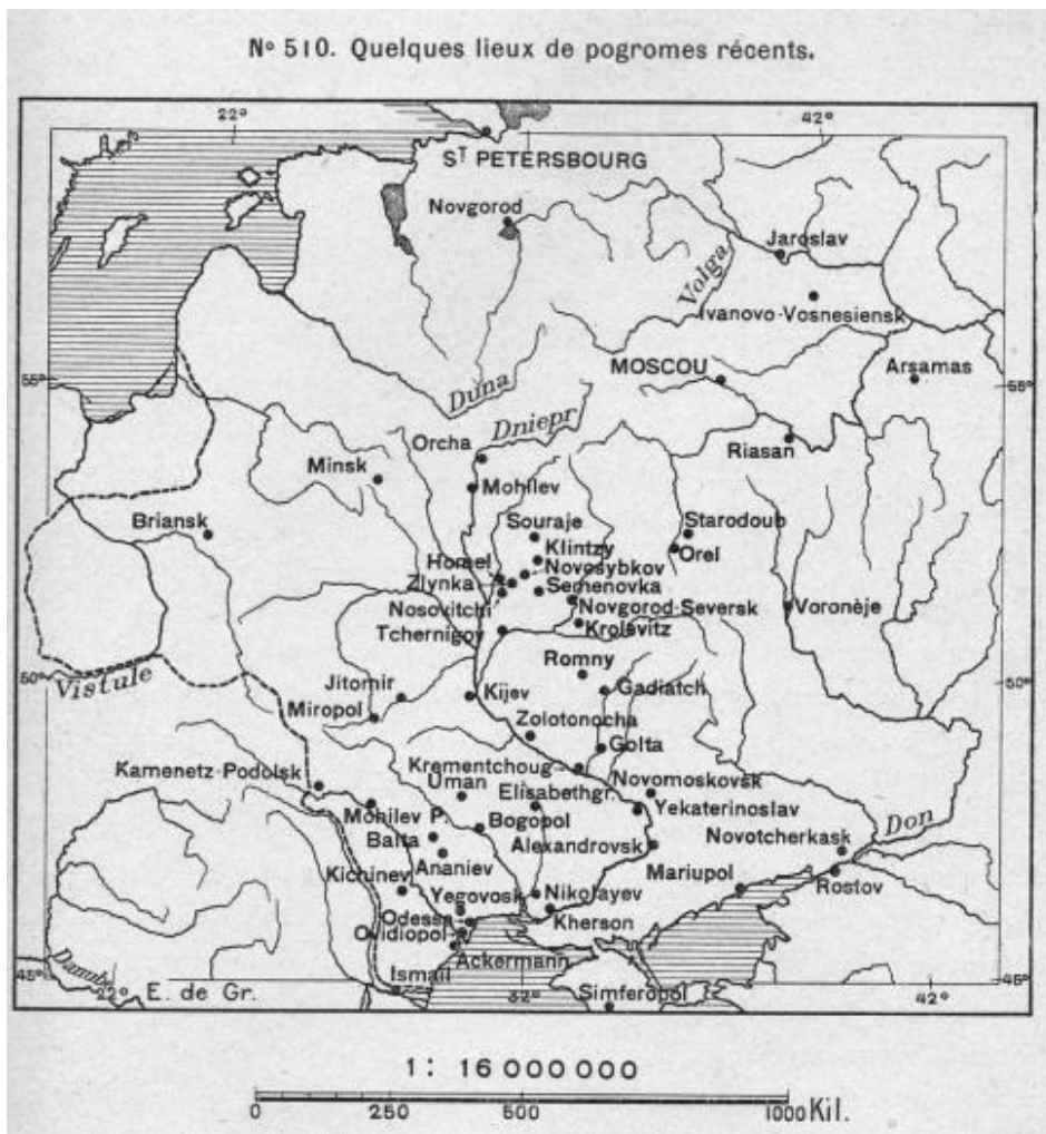
Figure 2 – Quelques lieux de pogromes récents.