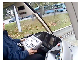
Figure 1 : Poste de conduite du tramway étudié

La conception usuelle laisse en effet, en tout ou partie, l'espace libre devant le conducteur, avec une répartition des commandes à gauche et à droite et une vision dégagée sur les écrans d'information.