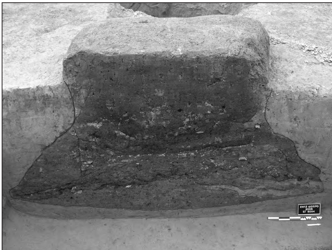
Fig. 1 – Silo de La Tène ancienne.

Avec sa cinquantaine de structures, le site de Geispolsheim «Schwobenfeld» constitue une des plus importantes occupations de La Tène A-B fouillée en Alsace (zone 5). Les structures identifiées sont principalement des silos de grandes dimensions, plutôt bien conservés (Figure 1). Les graines présentes dans les silos ne semblent pas liées à la fonction primaire des structures. L'économie