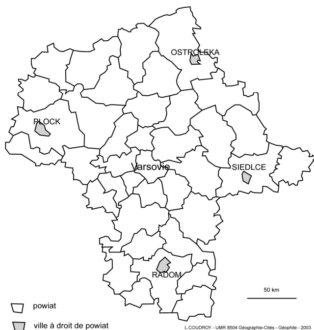
Carte 3 La Mazovie et ses powiat depuis 1998