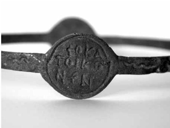
Figure 4. Début du psaume 90 © J. A. 2007.