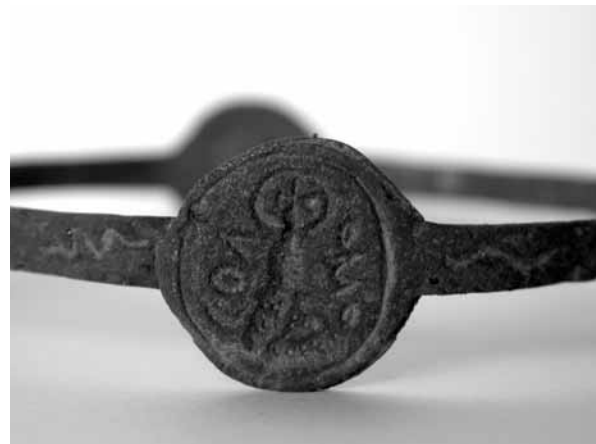
Figure 3. Invocation au nom de Salomon © J. A. 2007.