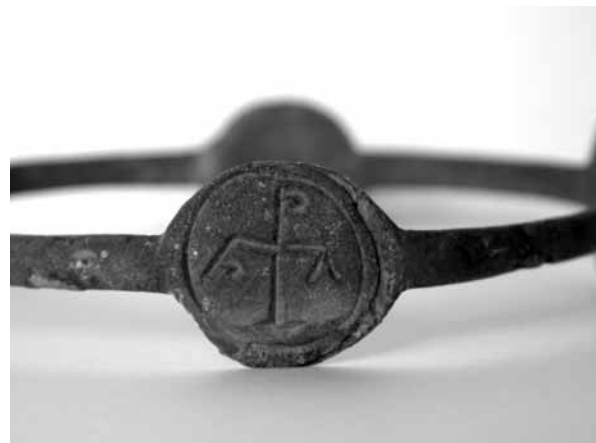
Figure 5. Croix chrismée © J. A. 2007.