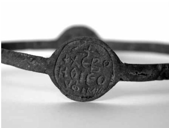
Figure 2. Supplique d'Euphémie © J. A. 2007.