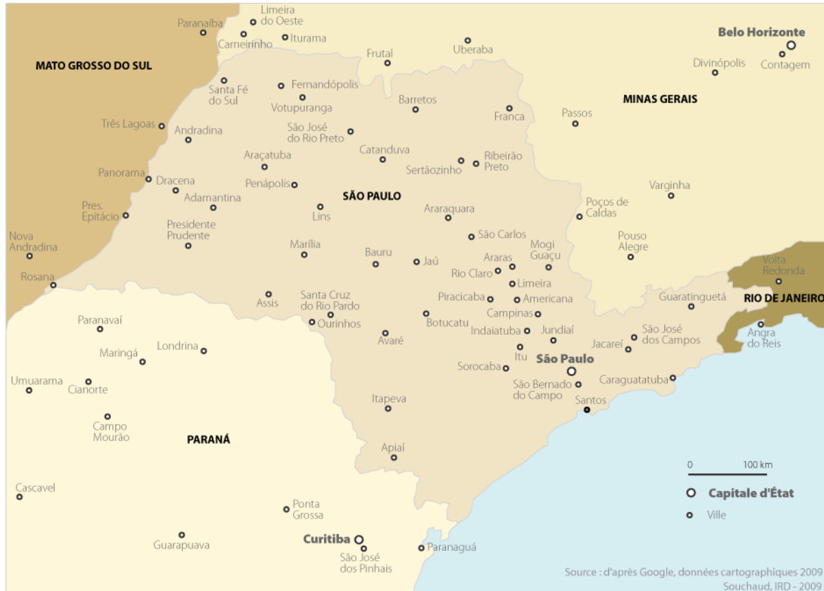
Carte 1 : Le São Paulo.

Néanmoins, la production de masse de heurte à deux obstacles. Le premier réside dans les difficultés d'acheminement de la production. Holloway (1984, p.39) rappelle qu'au milieu du XIXème siècle, pour transporter le café entre Campinas et Santos, le port d'exportation, via São Paulo, il fallait de trois semaines à un mois. La marchandise était confiée à des caravanes de mules qui franchissaient les pentes escarpées de la Serra da Mar en suivant des sentiers tracés dans la forêt.