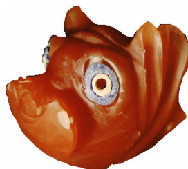
figure 3 : tête de cochon en cornaline, Kt 95/k 110 (niveau Ib) d'après le calendrier du Musée d'Ankara