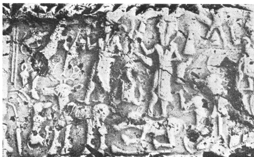
figure 4 : sceau Kt c/k 807 d'après ÖZGÜÇ N., 1965, pl. VII 19