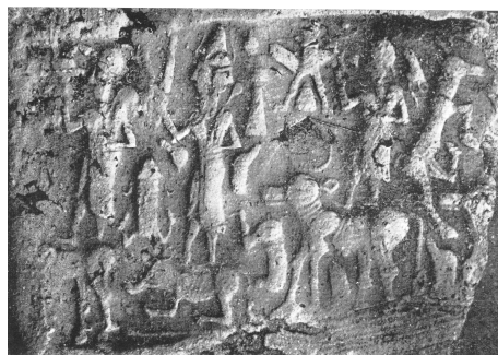
figure 5 : sceau Kt c/k 807 d'après ÖZGÜÇ N., 1965, pl. VII 20