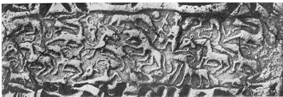
figure 6 : sceau Kt c/k 807 d'après ÖZGÜÇ N., 1965, pl. XXVII 82