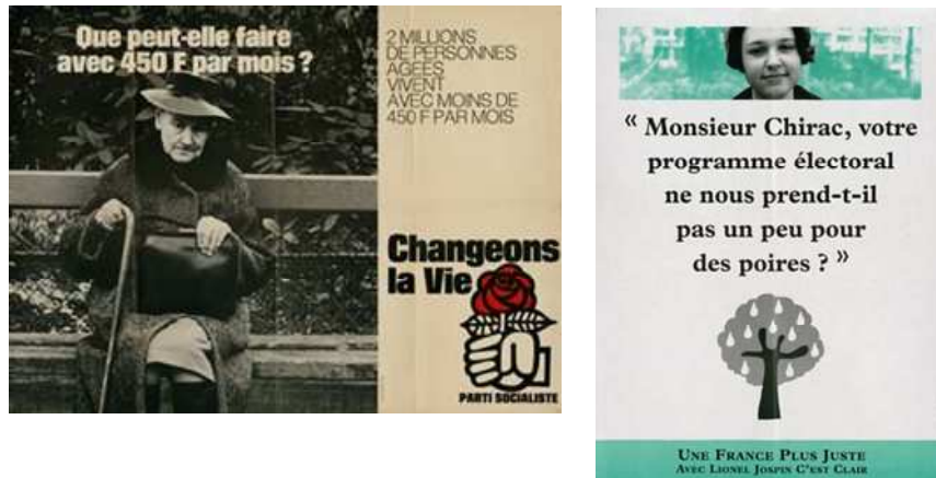
Figure 1 : Exemple d'affiches du Parti Socialiste.