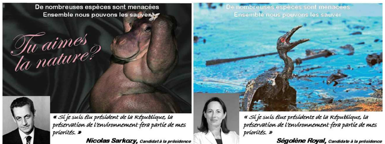
Figure 2 : exemples des visuels utilisés

Deux visuels proches de ceux de la Fondation Nicolas Hulot ont été utilisés. Des visuels publicitaires papier permettent de maîtriser un maximum de paramètres. De plus, l’affiche est un support de communication classique lors des campagnes électorales françaises. Seule l’image a été manipulée pour obtenir le procédé d’attention désiré, le texte et la photo des candidats apparaissent de façon identique sur tous les visuels (encadré 1). Seul le texte associé au visuel est modifié selon le type de procédé concerné. Nous avons contrôlé le fait que les répondants ne connaissaient pas les visuels au préalable.