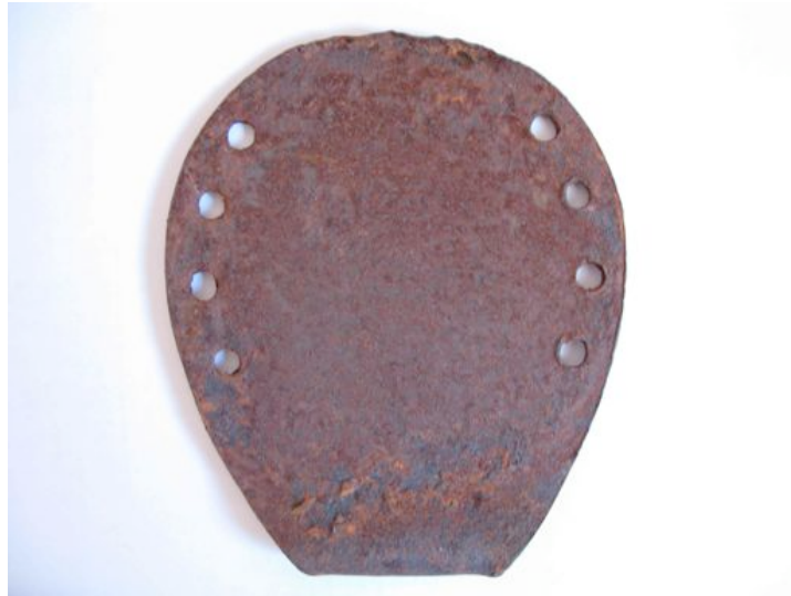
Fig. 7 - Fer à cheval de type oriental (grec moderne)