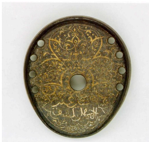
Fig. 5 – Fer à cheval de type oriental (turc) (reproduction depuis, Chevaux et cavaliers arabes dans les arts d'Orient et d'Occident , Paris 2002, n° 47, 112)