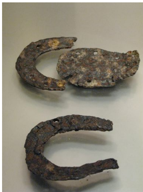
Fig. 6 - Fers à cheval de type européen et oriental (byzantins) Athènes, musée byzantin (inv. BXM 867-868), IX e -XII e s.