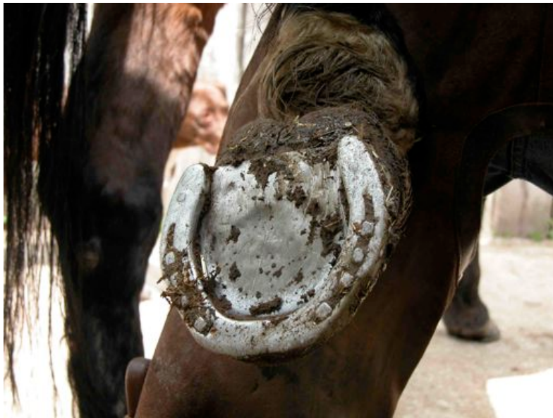
Fig. 8 – Fer à plaque (photo de l'auteur)