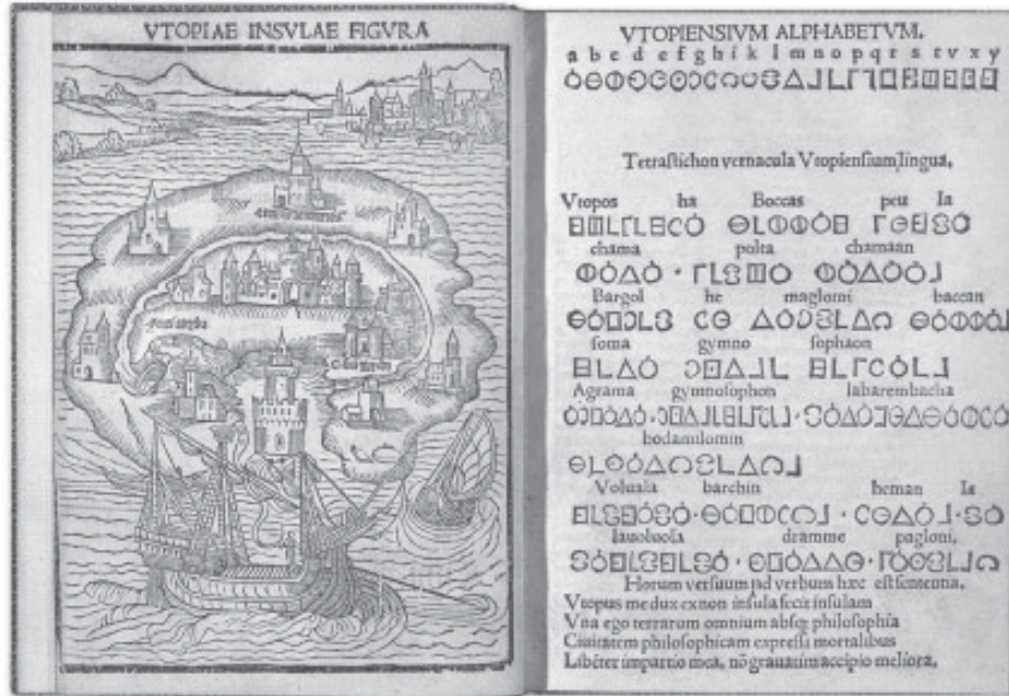
L'île d'Utopie en frontispice de l'édition originale de L'Utopie de Thomas More (1516). Fac-similé reproduit dans Sargent et Schaer, 2000 : 114.