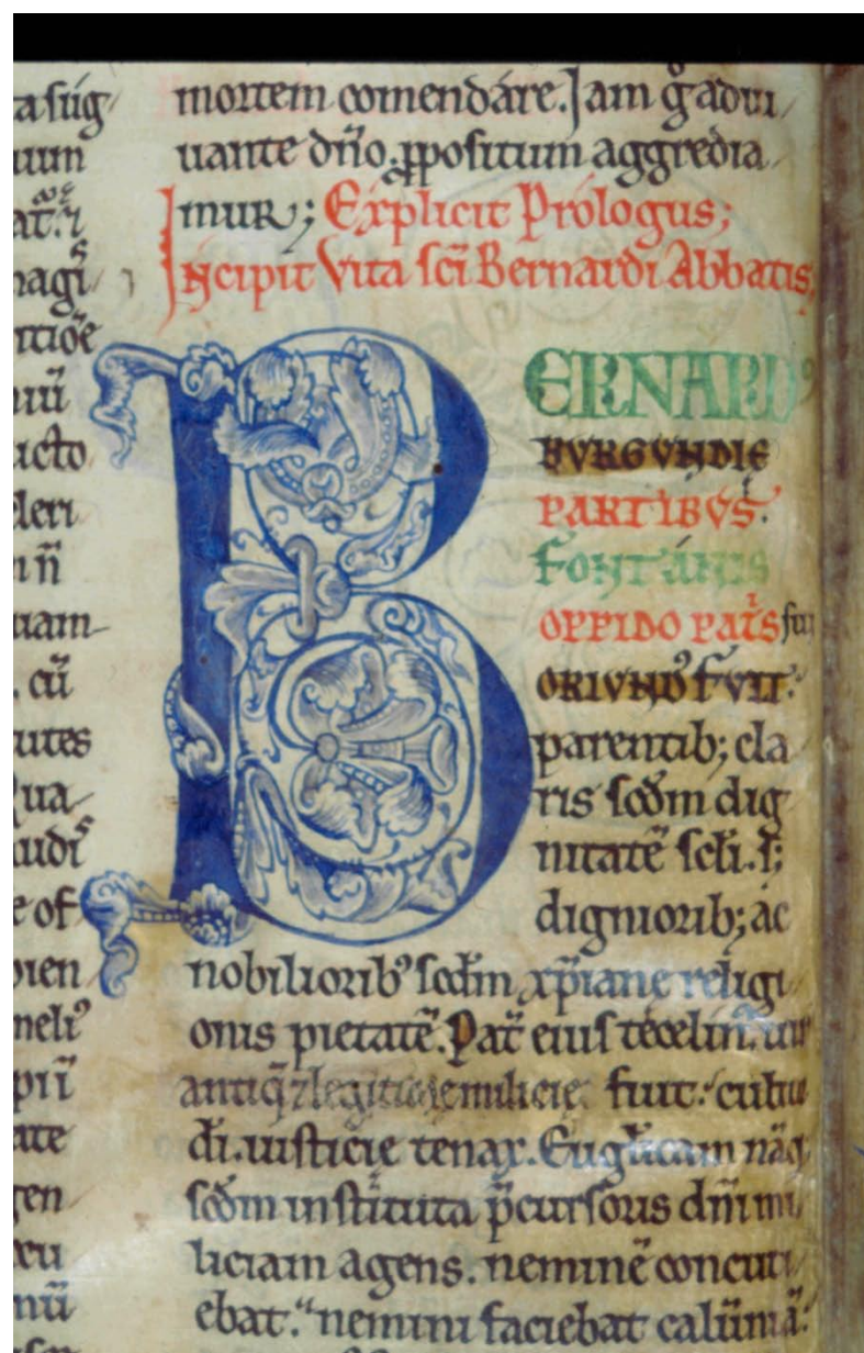
Dijon, B.M., ms. 659, fol. 3v : début de la Vita Prima .

Laurence Mellerin, CNRS, Institut des Sources Chrétiennes