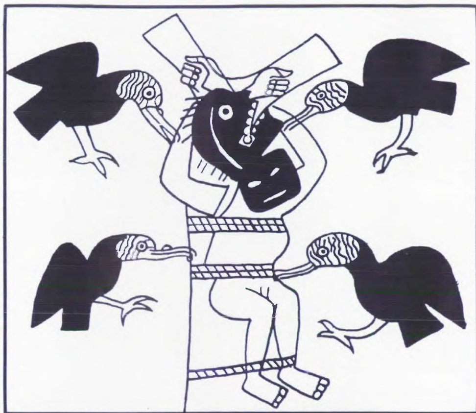
Fig. 3.- Ajusticiado por los buitres, la piel de la cara está arrancada (según Hocquenghem, 1987: Fig. 31).

La comunidad, que constituye el polo dominado, produce un excedente percibido en forma de tributo por la élite, que lo utiliza y lo redistribuye parcialmente en caso de necesidad entre dos cosechas. La élite detentora del poder político y económico es también titular de los cargos ceremoniales. Es así que la élite está investida del poder simbólico de contacto y de negociación con los ancestros míticos quienes detentan el poder de animar a los seres, transmitiendo la fuerza vital, el camac (a propósito de camac , ver Taylor, 1974-1976). Parte de la élite, investido del todo poderío de los ancestros míticos, el sacrificador es temido y venerado por la comunidad. Su poder mortífero sirve para garantizar la reproducción del grupo y para mantener el orden social, en el marco de los ritos propiciatorios y expiatorios. Actúa en nombre y en lugar de los ancestros míticos cuyos rasgos toma: no tiene nunca figura humana.