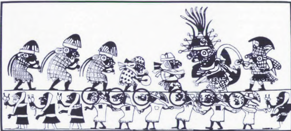
Fig. 4.- Danza ritual con máscara de piel (según Hocquenghem, 1987: Fig. 164).

Los ritos de propiciación y de expiación adquieren toda su importancia en un contexto conflictual en el que las relaciones de fuerza entre las comunidades se traducen por relaciones de fuerzas entre los ancestros. Estamos en presencia de una simetría entre la jerarquía simbólica y la jerarquía social. La élite usa el temor que el poder de los ancestros inspira a los miembros de la comunidad para imponer su orden. El sacrificador y el sacrificado, intermediarios entre el mundo de los ancestros y sus descendientes, heredan una valorización específica: uno está dotado del poder de muerte, terrible potencia, el otro es llevado a mostrar un abandono total. Si la iconografía presenta el sacrificador en el cumplimiento de los actos necesarios para la reproducción de su grupo, es verosímil que este personaje podía ejercer su poder en sentido contrario, conjugando en su persona el doble potencial de curandero y de brujo.