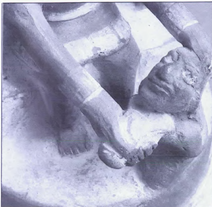
Fig. 1b.- Detalle que muestra el cuchillo ceremonial: el tumi (museo de Etnografía de Berlín - VA 18096).

que son presentados desnudos, las manos amarradas en la espalda, la soga en el cuello. La sangre, recogida en un cubilete en forma de cáliz, es presentada a los ancestros míticos antropomorfos. Algunos prisioneros degollados son transportados a las islas guaneras por los ancestros míticos, otros son descuartizados allí mismo. Tanto hombres como mujeres son desollados. Están desnudos, amarrados a la picota, la piel de la cara y de la espalda arrancada, son entregados a los buitres, lapidados y descuartizados (Fig. 3).