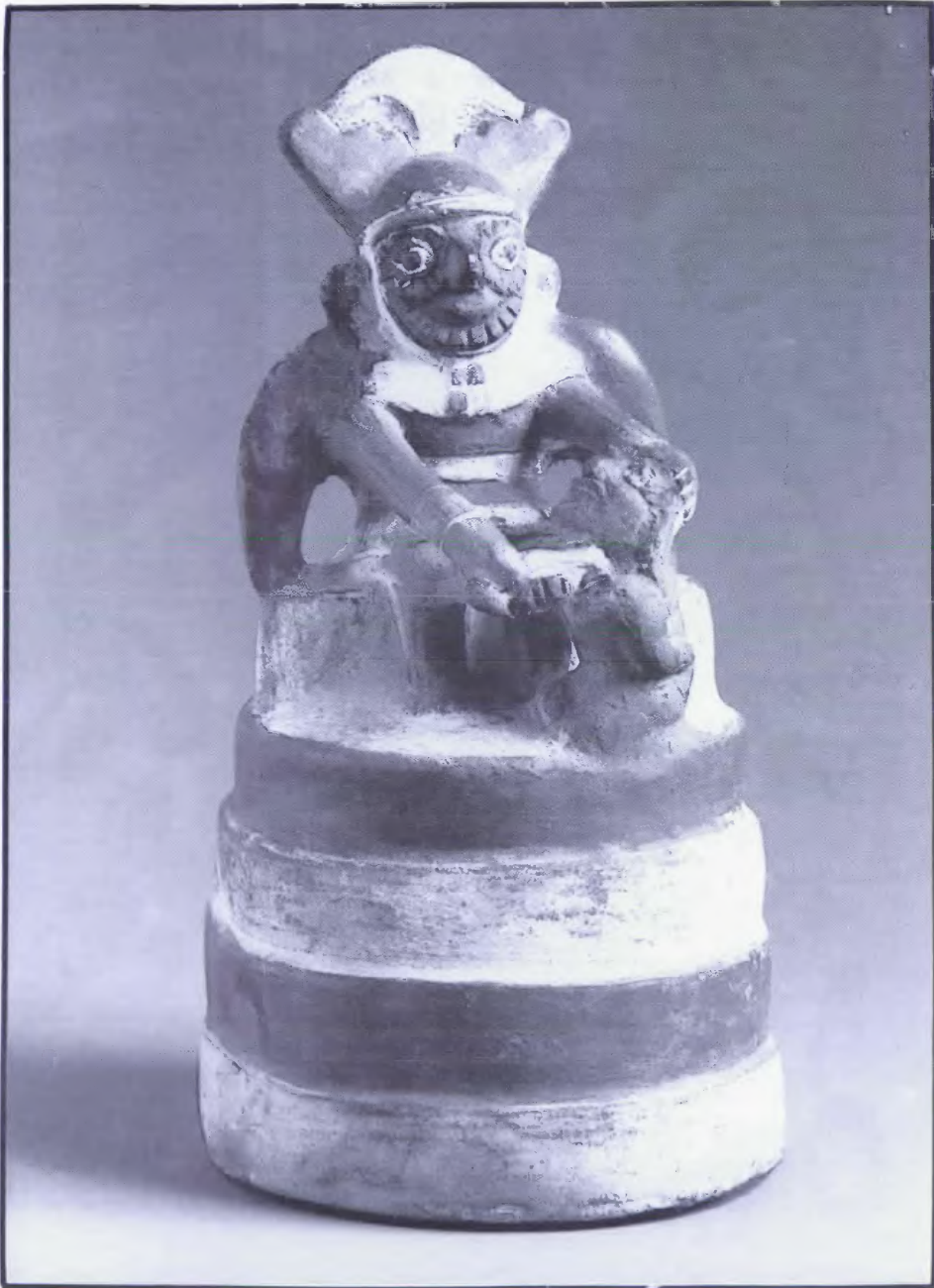
Fig. 1a.- Ancestro mítico zoomorfo cortando el cuello de un prisionero sacrificado (museo de etnografía de Berlín - VA 18096).