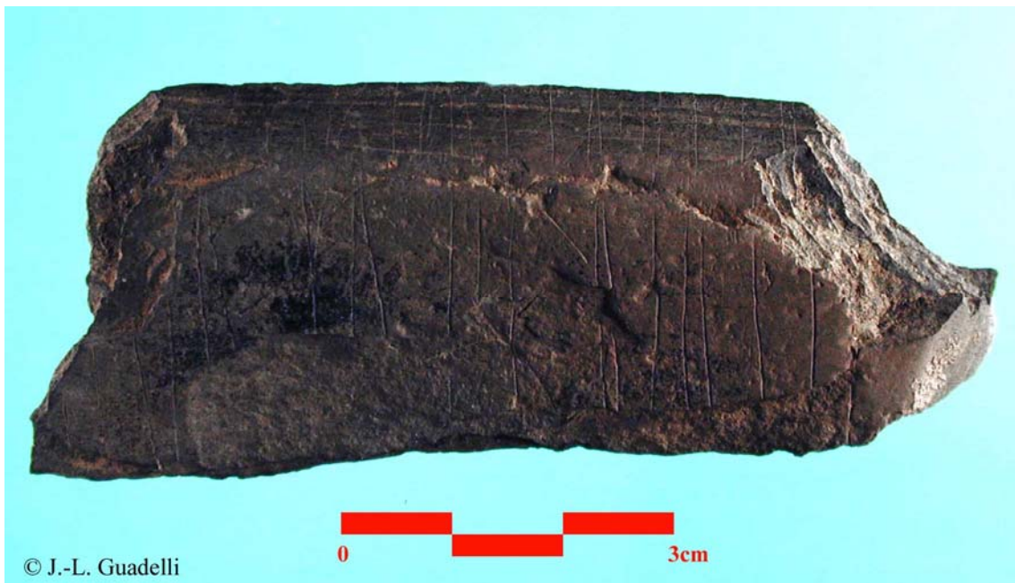
Galet de Temnata Dupka, Bulgarie.