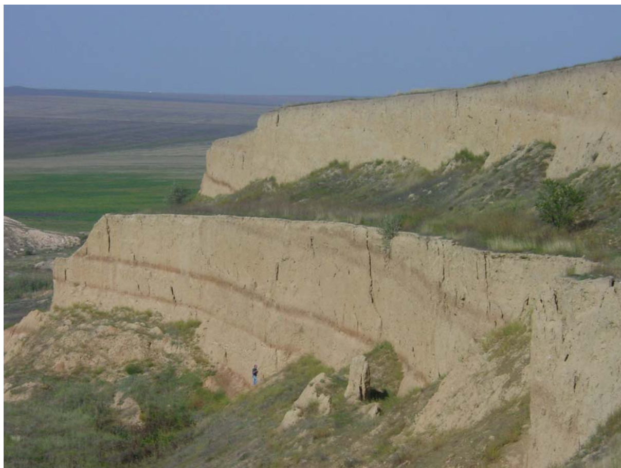
Séquence de loess couvrant les 400 derniers millénaires (Mircea Vodea, plaine orientale du Danube, Roumanie).