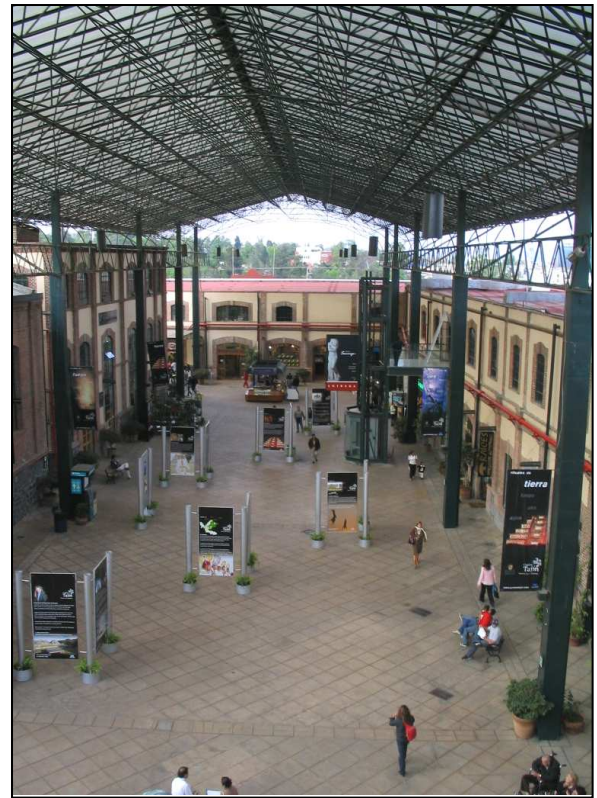
Photographie 2 : La nef de Plaza Loreto

Pour saisir leurs modalités de fréquentation, il faut d'abord préciser qu'en général les pratiques qui se développent dans les complexes commerciaux récréatifs sont, outre l'achat, la promenade avec laquelle il s'imbrique étroitement par le lèche-vitrines, et de nombreuses autres activités récréatives qui impliquent également une socialisation par la consommation, comme la rencontre pour une séance de cinéma ou de bowling, la discussion autour d'un repas, etc. C'est donc surtout leur offre globale qui conditionne leur fréquentation.