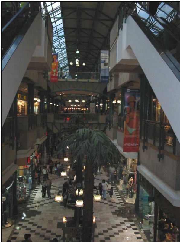
Photographie 1 : Vue intérieure de Galerías Coapa

- Plaza Loreto est une formule originale réhabilitant une ancienne papeterie, de taille modeste mais avec une offre commerciale et récréative variée qui insiste sur les activités culturelles (expositions, spectacles), situé dans une autre zone péricentrale, aisée cette fois.