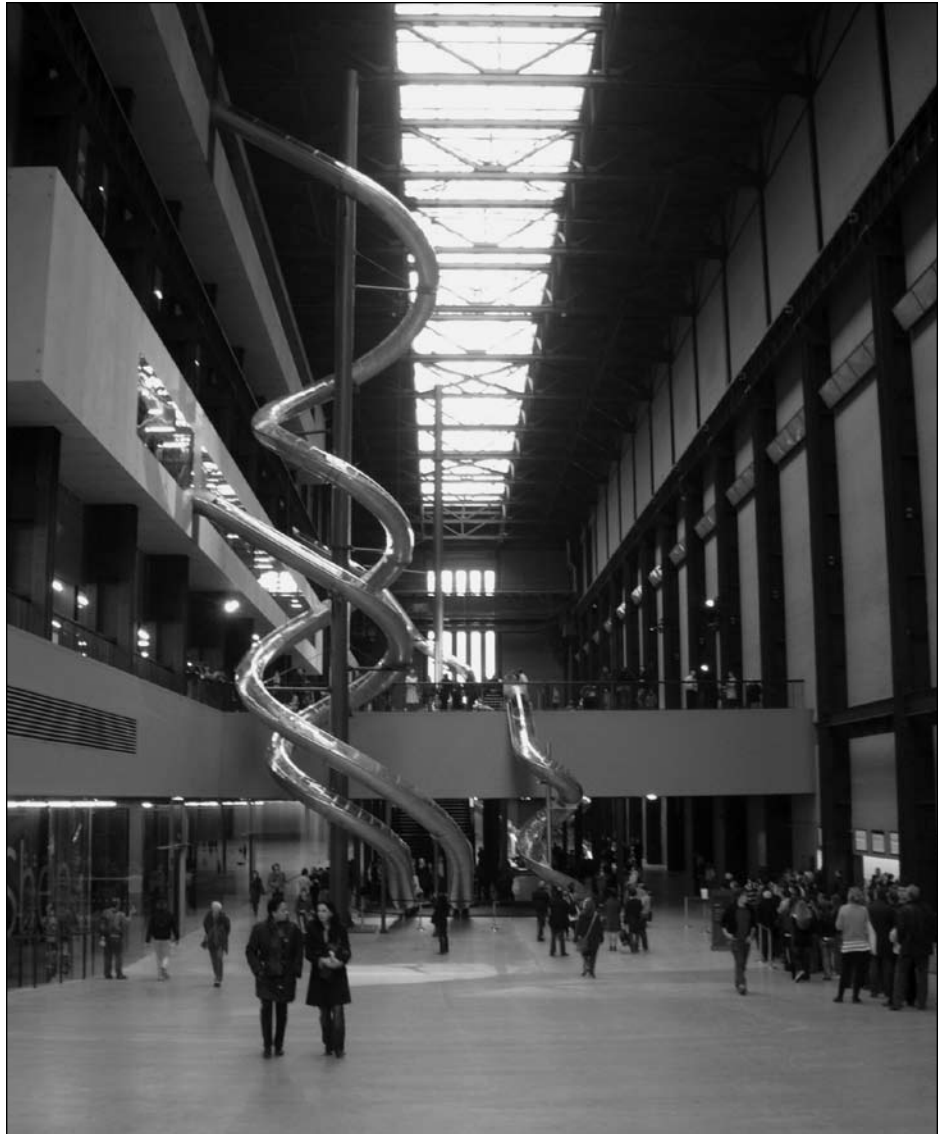
Illustration 2 : Les toboggans de Carsten Höller, Unilever Series, Turbine Hall, Tate Modern, Londres (10 octobre 2006 – 15 avril 2007).