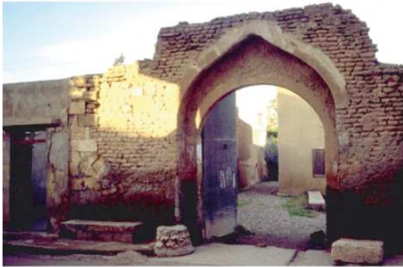
a : Entrée de la madâfa Hassûn (Raqqa)