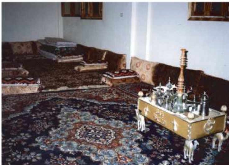
e : Mobilier d'une madâfa soukhniote (Raqqa)