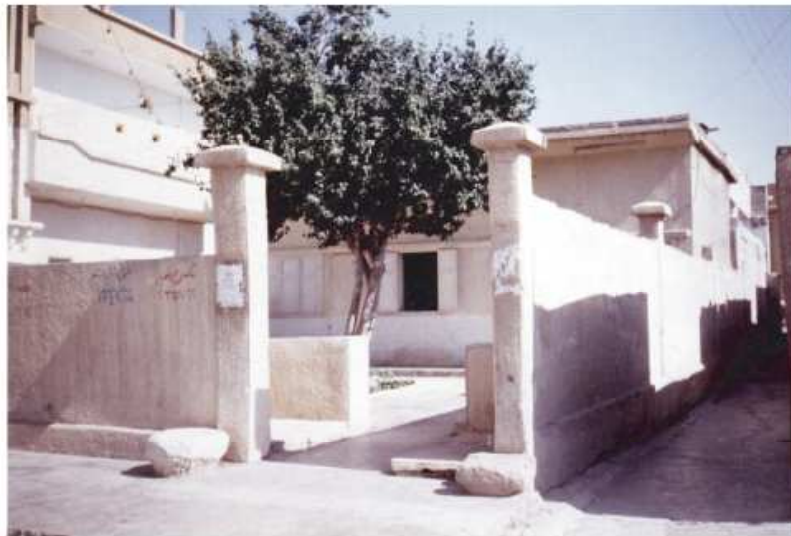
b : Entrée de la madâfa Bakri-Ka'kaji (Raqqa)