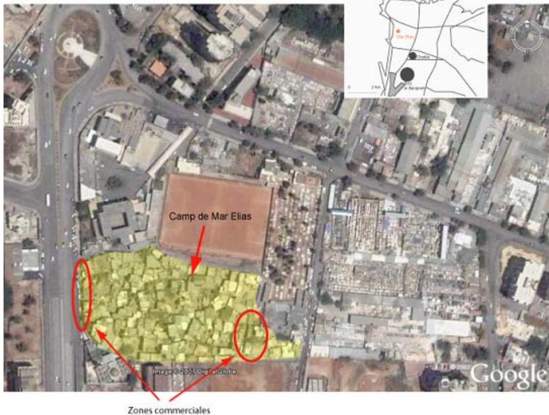
Le camp de Mar Elias - Beyrouth

Les commerçants interrogés ont décidé de développer leur activité dans le camp parce que le prix de la location du local y est moins élevé et aussi parce qu'en tant que Palestinien il leur est interdit de travailler hors des limites du camp. La clientèle vient elle en majeure partie des quartiers alentours, le pouvoir d'achat des habitants est généralement très faible et seuls les épiceries et les vendeurs de fruits et légumes vivent grâce à la clientèle palestinienne du camp.