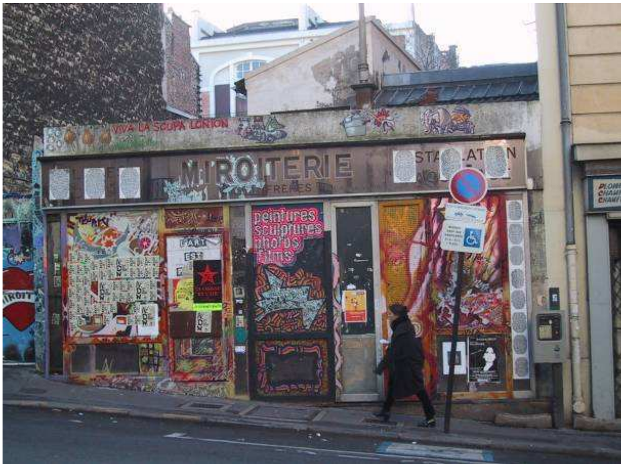
Cliché 2 : Le squat de la Miroiterie, rue de Ménilmontant, face au débouché de la rue des Cascades

ce squat devient un prétexte de promenade, qui permet, ensuite, la découverte du pittoresque paysage urbain l'entourant.