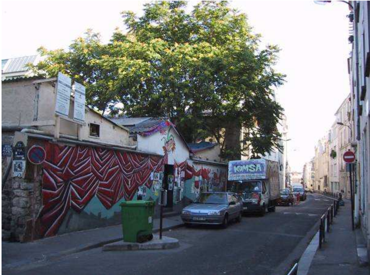
Cliché 1 : Le Théâtre de Fortune peu avant l'expulsion de ses occupants

« Théâtre de l'aurore ») qui a quitté les lieux pour exercer en province. Les bâtiments redevenus vacants ont rapidement été transformés en un squat artistique : le « Théâtre de Fortune » 14 .