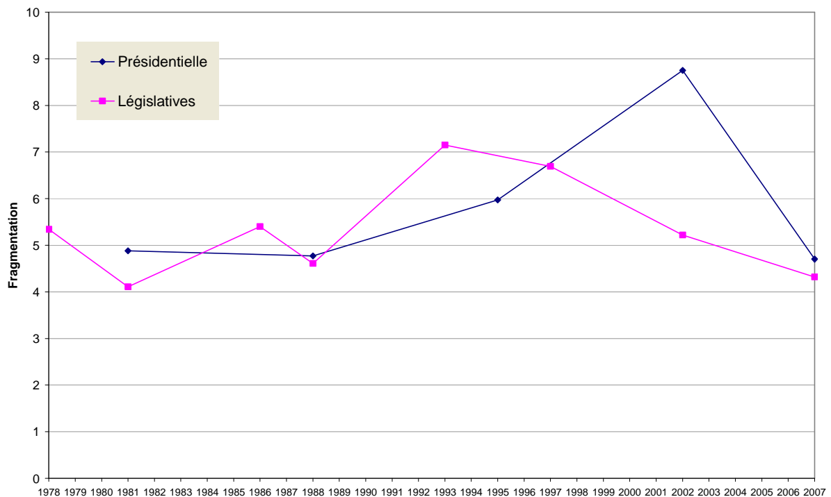
Figure 2 – Fragmentation du système partisan (1978-2007)