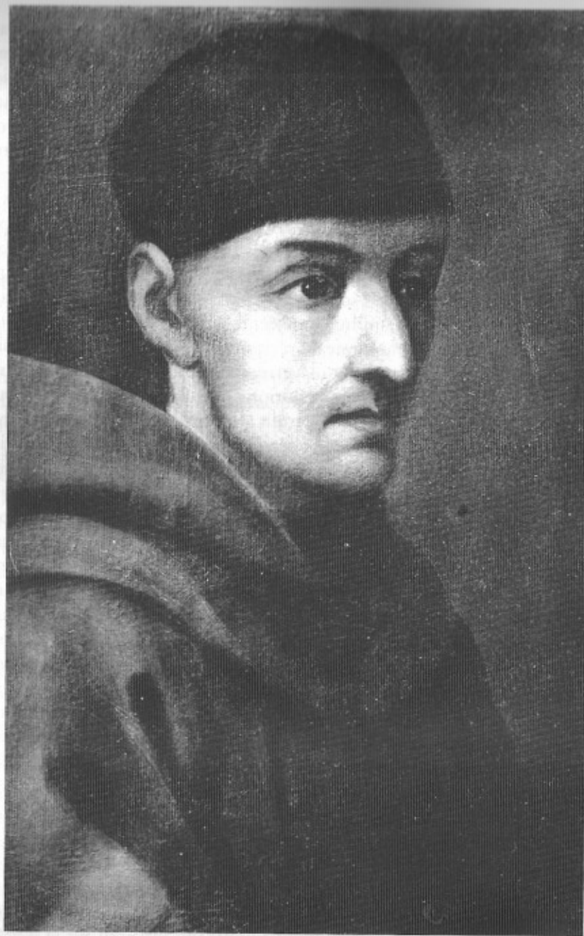
Frère Bernardino de Sahagún, franciscain

De son vrai nom Bernardino Ribeira, né en Espagne dans la province de Léon vers 1500, décédé au Mexique le 23 octobre 1590.