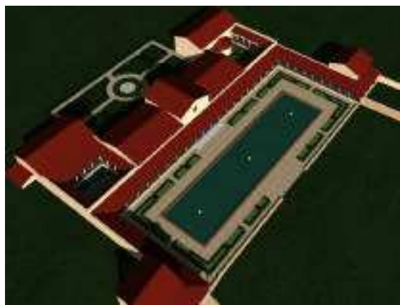
Fig. 1 : Vue aérienne de la villa

La partie centrale de la villa (118m x 62m) s'organise autour d'une salle d'apparat monumentale flanquée de pièces à vivre, chambres, cuisines, etc. De chaque côté de ce bâtiment principal se trouvent deux cours à péristyle menant pour l'une à un très grand triclinium et pour l'autre à l'ensemble balnéaire (Fig. 1).