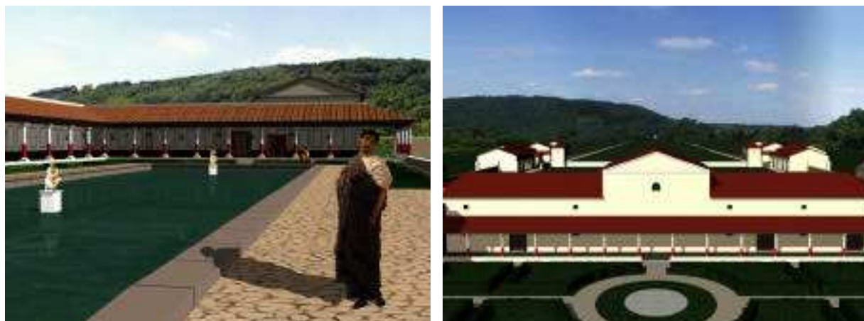
Fig. 10 et 11 : la villa et ses dépendances dans son site.

Pour les images détaillées en extérieur, la villa virtuelle devant être incrustée dans son site réel, une prise de vue photographique à 360° et retravaillée pour y faire disparaître tout élément contemporain (ainsi que tous les arbres résineux absents au premier siècle) a été élaborée (Fig. 10 et 11)