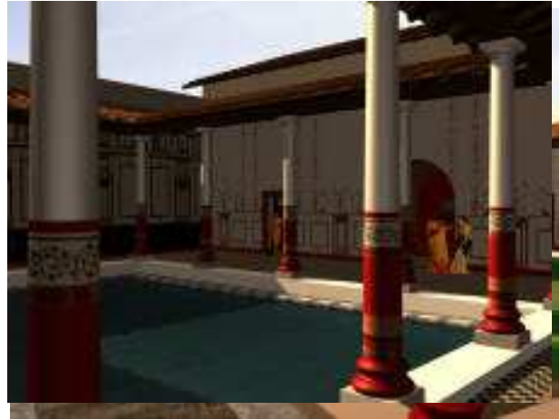
Fig 4 et 5 : Hypothèses de restitution du triclium

Il est à noter également que les nombreuses rencontres inter-disciplinaires (archéologues-architectes-infographistes) furent le lieu privilégié des réactions et nouveaux questionnements : les images en cours d'élaboration sont un facteur « déclencheur » indéniable pour l'archéologue. Il réagit sur la nature et l'aspect des matériaux, la conformation des éléments architecturaux, les proportions ou encore les procédés constructifs qui sont de facto mieux cernés, la visualisation tridimensionnelle met en évidence des points habituellement laissés dans l'ombre. C'est principalement pour cette raison que la phase de reconstitution proprement dite est plus porteuse d'avancées dans la connaissance archéologique du bâtiment ou du site que les résultats visuels qui en sont tirés.