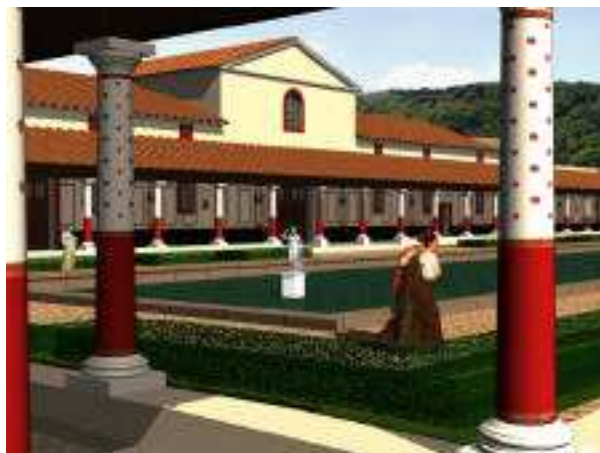
Fig. 6 et 7 : Façade sur cour et façade « arrière » du bâtiment central.

Une première série d'images montrant les différents corps de bâtiments et la manière avec laquelle il composent l'édifice d'origine a été produite (Fig. 6 et 7), se poursuivant avec l'adjonction de bâtiments supplémentaires lors de la deuxième période de construction au début du 2 e siècle. Certaines de ces images ont été calculées depuis un point de vue virtuel identique à celui d'un observateur situé devant le panneau sur lequel est imprimée l'image, lui permettant d'imaginer la volumétrie du bâtiment en fonction des restes devant lesquels il se trouve.