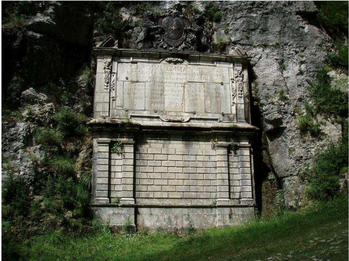
Monument érigé en l'honneur de Charles-Emmanuel II, en bordure de la route des Echelles (1670) (état en août 2007,)