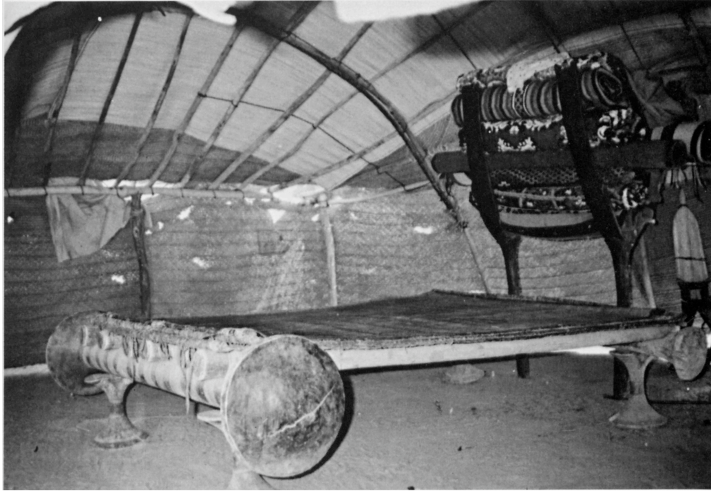
3. L'intérieur de la tente, vu du sud-ouest. Agadez, décembre 1984.