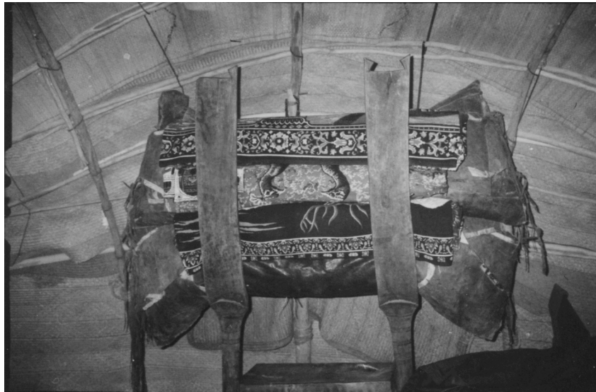
2. L'égéd. Tente de forgerons. Ouest d'Agadez. 1981