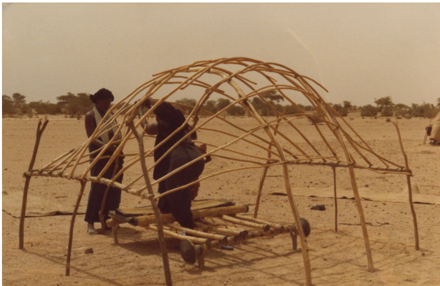
5. Femmes en train d'arrimer les lattes aux arceaux. On voit l'entrait nord au premier plan à gauche. 1980