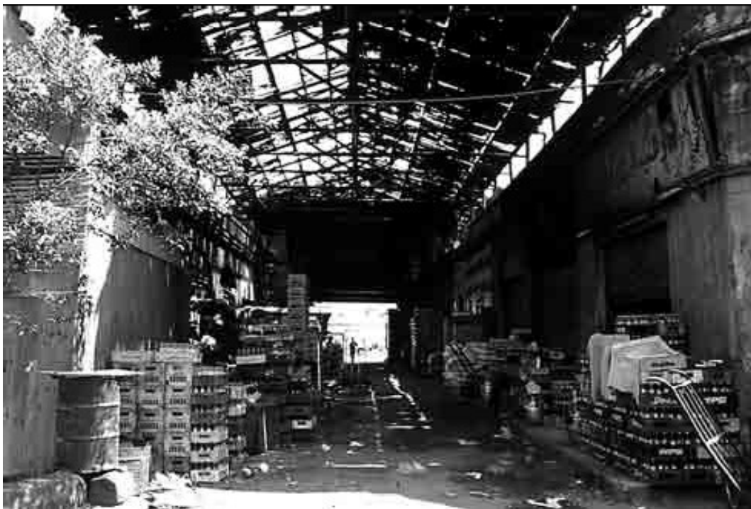
Vue de l'allée principale du marché de la Gare du Caire, dans son état actuel(photo Pascal Garret - 1995).

trains de Haute-Egypte et du delta du Nil, de la gare du Pont Limoun qui dessert la ville nouvelle d'Héliopolis et de plusieurs lignes de tramways. Ce Marché de la Gare du Caire reprend le schéma, désormais classique, des deux allées en croix, pavées et couvertes, qui organisent quatre pavillons composés de boutiques en rez-de-chaussée et d'un étage partiel contenant des bureaux, composant là un ensemble d'environ 4500 mètres carrés au sol. Marcel Clerget, qui parle de ce bâtiment dans sa thèse sur la ville du Caire, explique que "ce marché a profité des enquêtes menées en Europe pour étudier les organismes analogues. Il possède des bureaux, des boutiques en location, des canalisations pour évacuer les eaux, une installation sanitaire moderne, un contrôle des poids et mesures par des fonctionnaires, des frigorifiques très vastes, des fours pour hâter la maturité de certains fruits, comme les bananes. Il est ouvert jour et nuit. On y vend aux enchères" 14 .