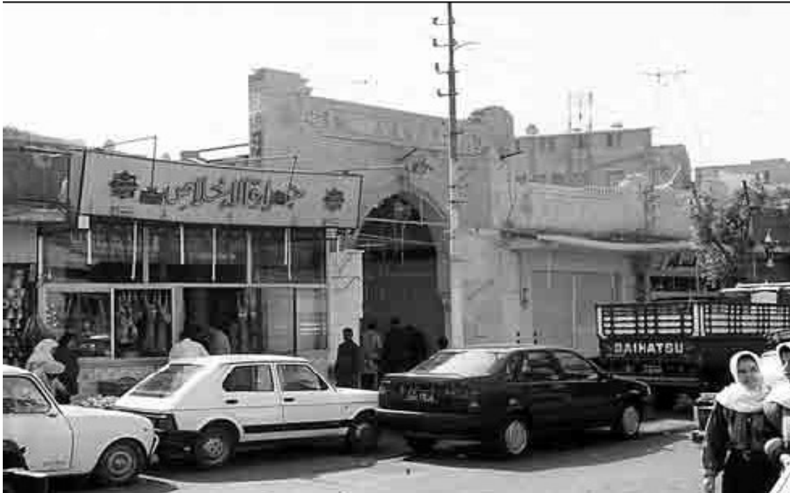
Vue d'une des entrées latérales du marché d'Héliopolis (photo Pascal Garret - 1995).

peut donc être comparé à ceux de Attaba, d'Alexandrie ou de Bab el-Louk.