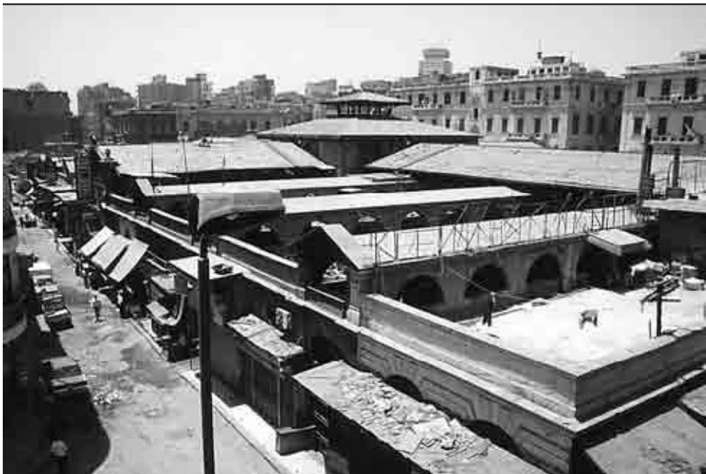
Vue générale du marché de Attaba, dans son état actuel (1995).

Ce lieu est ainsi spécifiquement dévolu à une vente d'alimentation qui est spatialement organisée et contrôlée aux niveaux sanitaire et fiscal, de manière permanente et réglée. Le choix de son emplacement est, lui aussi, apparemment calculé, au carrefour de nombreuses avenues qui rayonnent vers tous les quartiers du Caire et sur lesquelles sont progressivement construites de nombreuses lignes de tramways.