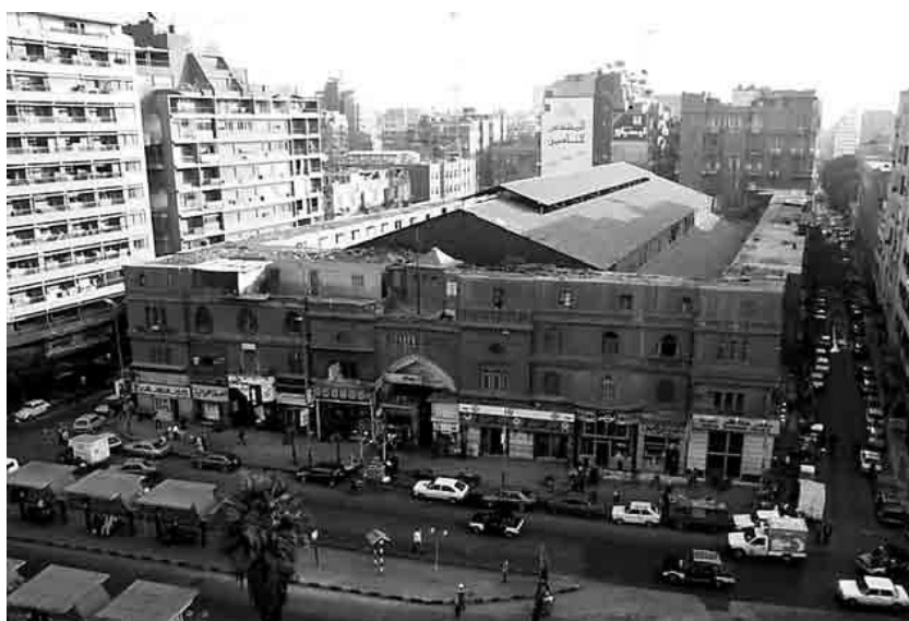
Vue de l'état actuel du marché de Bab el-Louk. Le deuxième étage, reprenant l'esthétique du premier, a été construit dans les années 40, le troisième fut bâti en plusieurs étapes depuis les années (photo Pascal Garret - 1995)

Il est probable que les deux frères, à court de finances, soient obligés de s'adresser à la même banque pour réaliser leur projet de marché, et que leur idée soit reprise à cette occasion par les fondateurs de la Société des Halles Centrales d'Egypte. On peut imaginer que ceux-là font alors pression avec la Bank of Egypt , par l'intermédiaire de Moïse Cattai, pour obliger les frères Khairy à céder à bon compte terrain et autorisations à la dite société. L'achat du terrain n'est justement pas payé comptant aux deux frères Khairy : pour éviter de déboursier une telle somme, une augmentation de capital de la Société des Halles Centrales d'Egypte est effectuée par l'émission de 12 500 nouvelles actions de 4 LE, le capital passant de 30 000 à 80 000 LE. La transaction d'un montant de 71 500 LE est alors réglé de la manière suivante : 3 000 LE sont payées au comptant, 13 500 LE sont versées directement à la National Bank of Egypt pour rembourser le crédit obtenu par les frères Khairy et lever l'hypothèque sur le terrain, 5 000 LE sont rendues sous la forme de 1 250 nouvelles actions de 4 LE à Constantin E. Achillopulo (déjà actionnaire de la Société) en remboursement d'un prêt de la même somme qu'il a auparavant consenti aux frères Khairy et enfin, les 50 000 Livres restantes sont payées sous la forme de 11 250 actions de 4 LE.