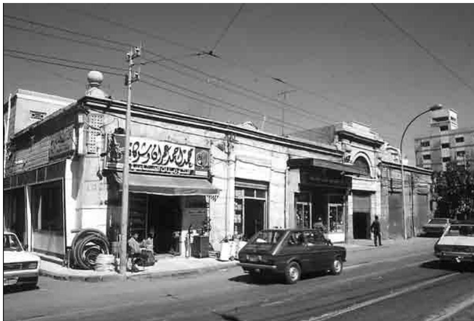
Vue actuelle du Nouveau Marché d'Alexandrie, côté porte principale. Ce marché n'est plus en activité et trois des quatre « halls » n'ont plus de toiture. L'ensemble a été subdivisé en petits ateliers de réparation de voitures, de chaudronnerie et garages.

En dehors des références à l'Europe et à une modernité technique, ce dernier texte introduit une dimension supplémentaire, celle de la valeur commerciale que pourrait avoir ce nouveau marché.