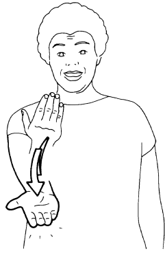
Fig. 7. C'EST ÇA ! Ivt 1986.