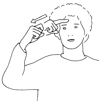
FIG. 3. BECAUSE 3.