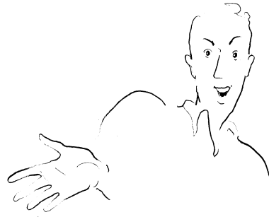
Fig. 8. « C'est ça ! ». Dessin de Zaü, dans Calbris et Montredon 1986.

C'est donc la LS fr. qui permet de répondre à toutes les questions soulevées par l'énigmatique signe BECAUSE et ses variantes. En retour, la LS amér. fournit des informations précieuses sur l'histoire du signe POUR ÇA en France même. Jamais signalé avant 1997, on pouvait le croire d'apparition récente ; sa présence sur le continent américain, qui ne peut être due qu'à son introduction par Laurent Clerc à partir de 1817, permet de repousser de près de deux siècles son usage à l'institut parisien de la rue Saint-Jacques, qui était alors la capitale du monde sourd.