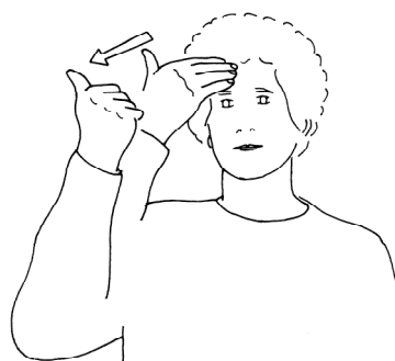
Fig. 2. BECAUSE 2.