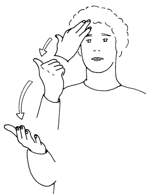
Fig. 4. BECAUSE 4.

Cela soulève trois questions. En premier lieu, s'agit-il de plusieurs variantes d'un seul et même signe, ou bien de signes différents n'ayant entre eux aucun lien historique ? En second lieu, si l'on n'a affaire qu'à un seul signe, comment expliquer cette étonnante multiplicité de variantes, dont l'une, insolite, comprend trois configurations successives ? En troisième lieu, quelle est l'étymologie de ce signe, ou de ces signes ? Elaine Costello (1999), qui est rarement en mal d'interprétations, reste cette fois silencieuse. Martin Sternberg (1994) propose une explication qui n'explique rien, si ce n'est le départ depuis le front : « une pensée ou un savoir