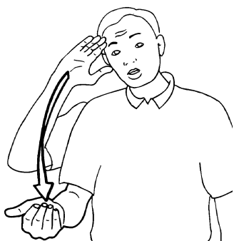
Fig. 5. POUR ÇA 2. Ivt 1997.

L'origine de ce signe demeure présente dans la conscience des locuteurs : c'est une forme simplifiée, que nous baptiserons POUR ÇA 1, d'un ancien composé POUR ÇA, commençant par POUR et se poursuivant par les lettres manuelles C et A. L'étymon se laisse plus facilement reconnaître dans un autre signe POUR ÇA 2 mentionné dans les éditions Ivt (fig. 5). Dans cette seconde forme plus usuelle, les lettres C et A sont aisément repérables. Le premier composant POUR a disparu, mais la trace s'en maintient avec le départ du signe à proximité du front. D'un signe à trois configurations ont donc dérivé deux signes dont chacun n'a retenu que deux configurations de l'étymon : POUR et A dans POUR ÇA 1, C et A dans POUR ÇA 2.