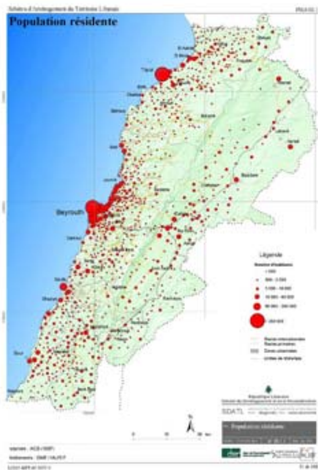
Fig 1 : La population résidente

Ce canal qui convoie l'eau depuis le lac de Qaraoun, formé par le fleuve Litani, avait été construit avant qu'il ne subisse les dégradations de la guerre. Sa réhabilitation, entamée en 1995 puis achevée en 2002, permet d'irriguer un casier de terres sises sur la rive orientale du Litani qui représente 2000 hectares répartis sur 5 villages (Joub Janine, Kamed el Loz, Baaloul, Lala et Qaraoun). Après trois années de fonctionnement, il est intéressant de voir si l'apport de ce canal constitue une avancée pour la zone. De fait, ce projet souligne, s'il était besoin, que le développement n'est pas réductible à de simples travaux d'aménée d'eau, contrairement à ce qu'une certaine pratique d'aménagement a pu faire croire.