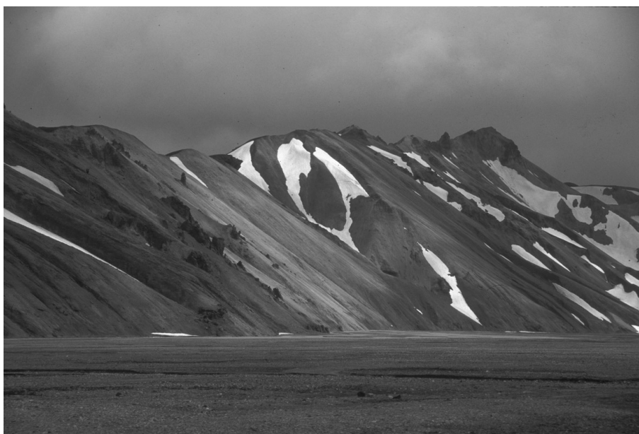
Figure 4. Eboulis rhyolitiques, Landmannalaugar.

On remarquera le déchaussement des dykes au sein des versants. Juillet 1994