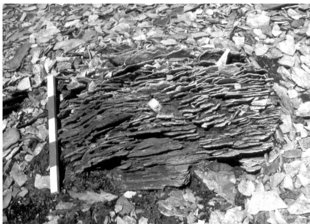
Figure 3. Débitage en plaquettes des rhyolites, Landmannalaugar, juillet 1997.