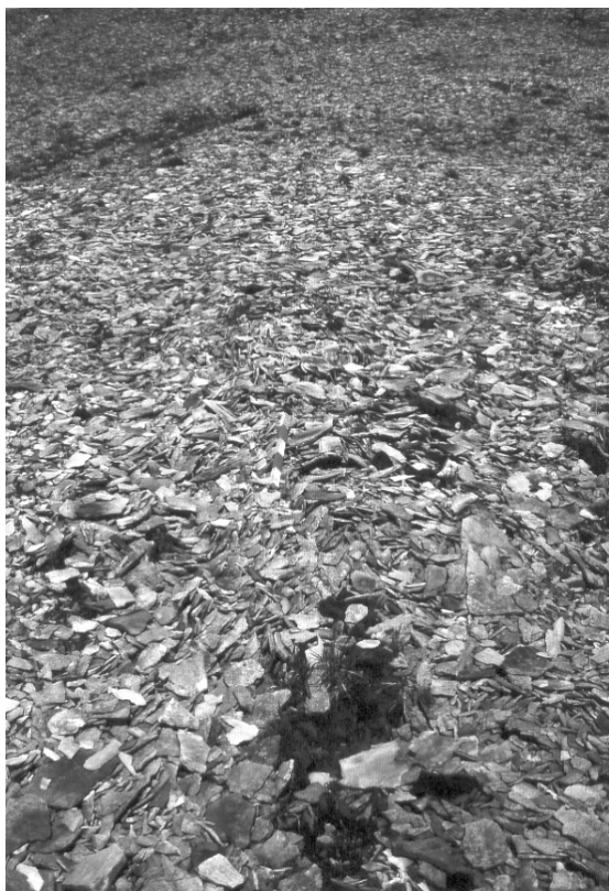
Figure 5. Dallage de gelifractes sur les interfluvés convexes rhyolitiques, Landmannalaugar.