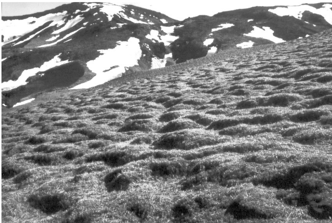
Figure 8. Versant hyaloclastitique à loupes de solifluxion, Krakatunga, Vik-i-Myrdal, mai 1997.

des corniches, des tabliers d'éboulis composés de lithoclastes anguleux drapent le pied des escarpements. La taille et la morphologie de ces lithoclastes sont bien souvent prédéterminées structurellement (fentes de retrait lors de la solidification de la lave, diaclases issues des ébranlements sismo-tectoniques), le gel agissant alors par simple effet de coin le long de ces lignes de faiblesse et non comme agent de découpage de la roche. Détaché de la paroi ou déposé par les glaciers, les lithoclastes basaltiques sont alors épargnés par le gel et les premières et seules transformations superficielles remarquables sont à attribuer aux microorganismes qui permettent le développement d'un cortex de météorisation (Etienne, 2002, figure 9). Ce n'est qu'après cet affaiblissement préalable des basaltes que le gel, sous forme de micro-gélifraction, intervient comme processus-relais, 150 ou 200 ans après la mise à l'affleurement des fragments basaltiques.