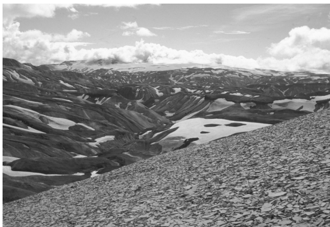
Figure 2. Le massif rhyolitique du Landmannalaugar.

Autre faciès particulièrement fissile, la hyaloclastite est une roche basique à faciès bréchiq produite lors d'éruptions subaquatiques. En Islande, ce mode d'éruption était fréquent lors des phases glaciaires (éruptions sous-glaciaires), elles furent suivies (ou précédées) de phases éruptives subaériennes lors des interglaciaires. Les éruptions sous-glaciaires peuvent donner naissance à des montagnes-