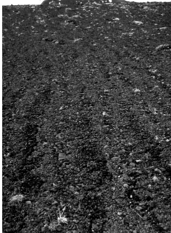
Figure 7. Sols striés sur le plateau de Skogaheidi, mai 1997.

La comminution de la matrice hyaloclastitique fournit une grande quantité de limons, tandis que les inclusions basaltiques, de granulométrie variable (mode : graviers), sont relativement épargnées par le gel. Une ségrégation progressive par les alternances de gel/dégel aboutit à la formation de sols striés dont les bandes grossières sont constituées de fragments basaltiques et les bandes fines de hyaloclastites.