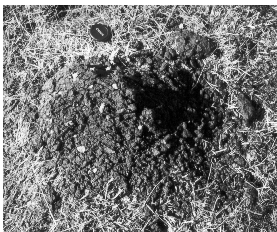
Figure 6. Pulvérisation des hyaloclastites par le gel, Krakatunga, Vik-i-Myrdal, mai 1997.

La comminution de la matrice hyaloclastitique fournit une grande quantité de limons, tandis que les inclusions basaltiques, de granulométrie variable (mode : graviers), sont relativement épargnées par le gel. Une ségrégation progressive par les alternances de gel/dégel aboutit à la formation de sols striés dont les bandes grossières sont constituées de fragments basaltiques et les bandes fines de hyaloclastites.