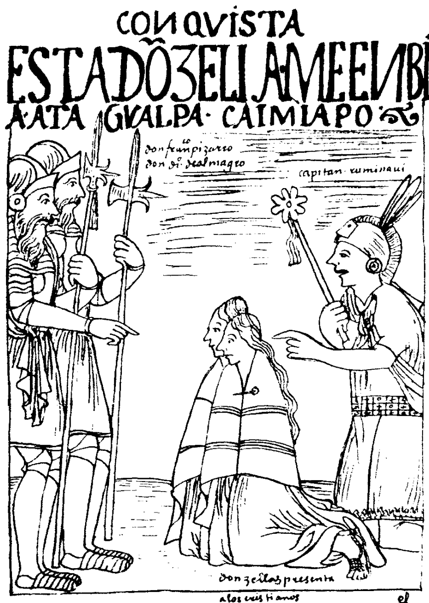
IMAGEN NÚM.3: Entrega de mujeres a los conquistadores españoles, por Huaman Poma. (HUAMAN, 1987: 387).