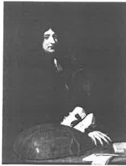
8. Ecole Française. Portrait d'un luthiste , huile sur toile, deuxième moitié du XVII e siècle. St Petersburg, Ermitage.

29 Catalogue d'exposition L'art en Lorraine au temps de Jacques Callot , Nancy, musée des Beaux-Arts, 1992, p. 276, notice par Jacques Thuillier n° 83, reprod. coul.