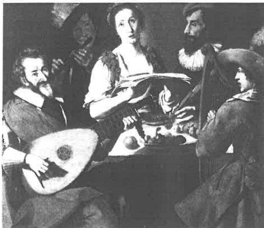
12. Peintre lorrain, premier tiers du XVII e siècle (?). Le concert, dit aussi La musique , huile sur toile. c. 1625-30. Cracovie, château du Wawel.

50 Voir la notice dans le catalogue l'exposition Le portrait toulousain de 1500 à 1800 , Toulouse, musée des Augustins, 1987-1988, n°37.