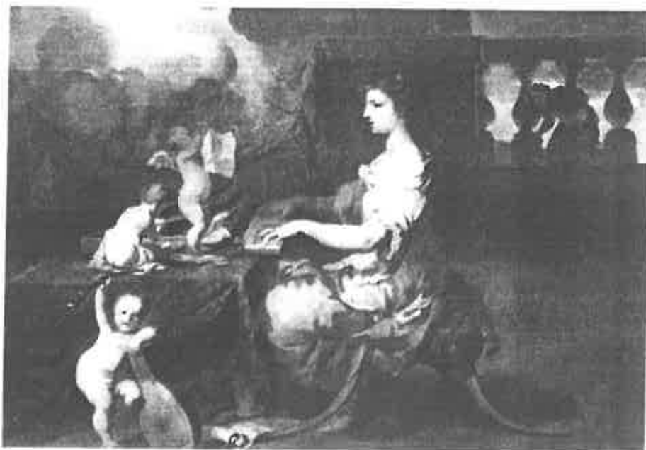
3. Pierre Puget (1620-1694), Sainte Cécile , huile sur toile, 1651. Marseille, musée des Beaux-Arts.

Puget « entendait la musique, il chantait et touchait des instruments ; il pinçait surtout très délicatement le luth ». Ce n'est donc pas par ignorance que le peintre s'est accordé quelques fantaisies dans le rendu des instruments. C'est plus l'atmosphère et la liberté de ton qui prédominent ici 10 .