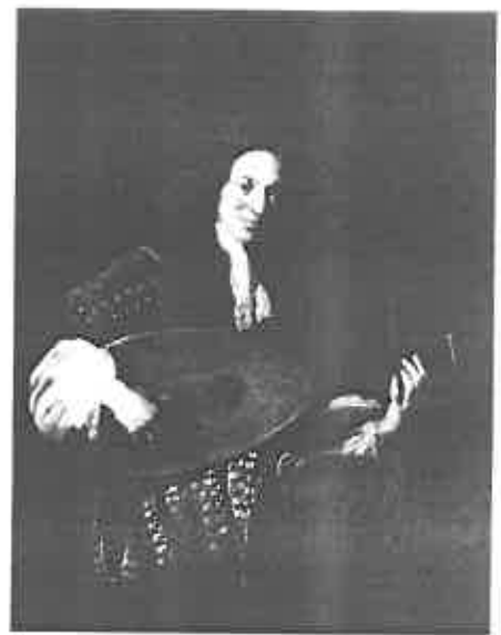
9. François de Troy (1645-1730). Portrait du luthiste Charles Mouton , huile sur toile, 1690. Paris, musée du Louvre.